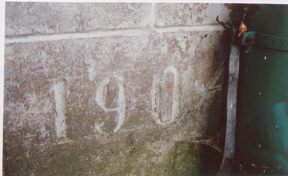
Data wyryta na cokole w elewacji północnej