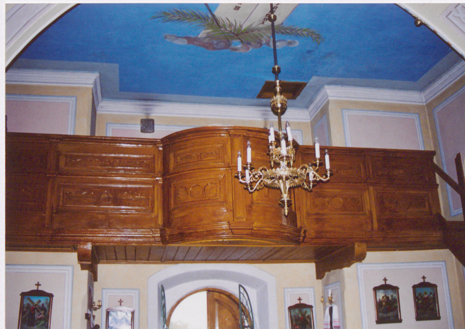
Widok ogólny babińca i chóru

Wkładkę założył: K. Szuwarowski, 10. 2002 r. K. Szuwarowski (imię i nazwisko, data)