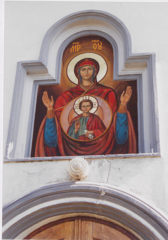
Malowidło nad wejściem głównym