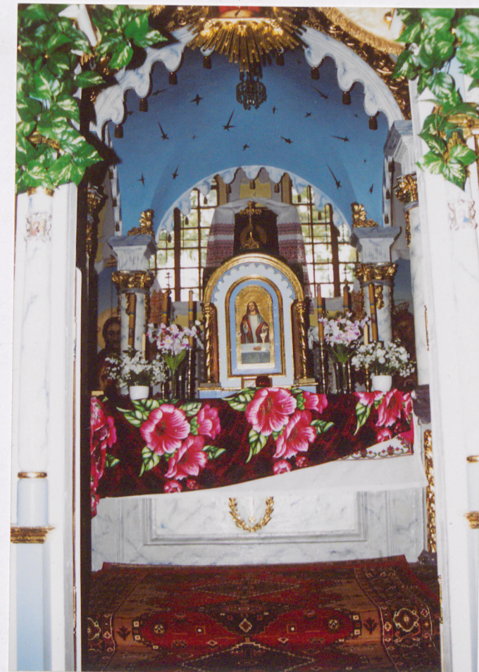
Cyborium z tabernakulum. Widok przez Carskie Wrota