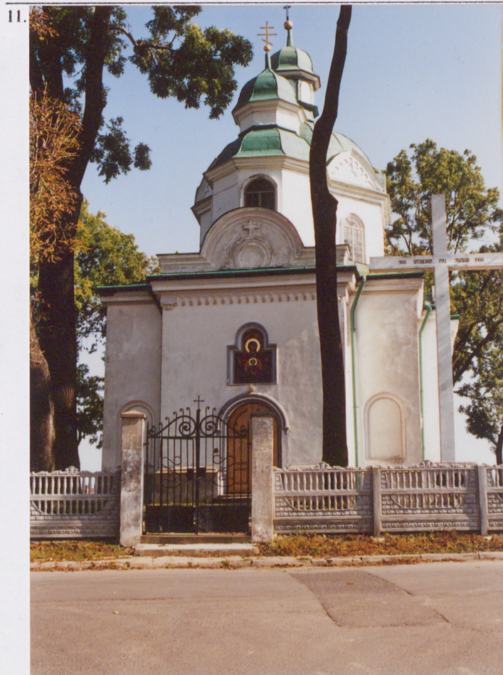
Widok elewacji frontowej cerkwi