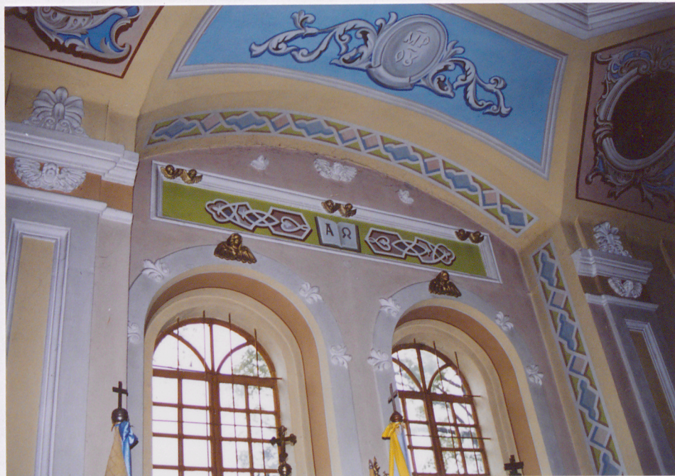
Okna w bocznej ścianie nawy