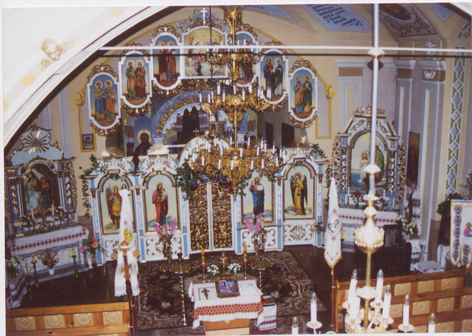
Nawa główna. widok na ikonostas