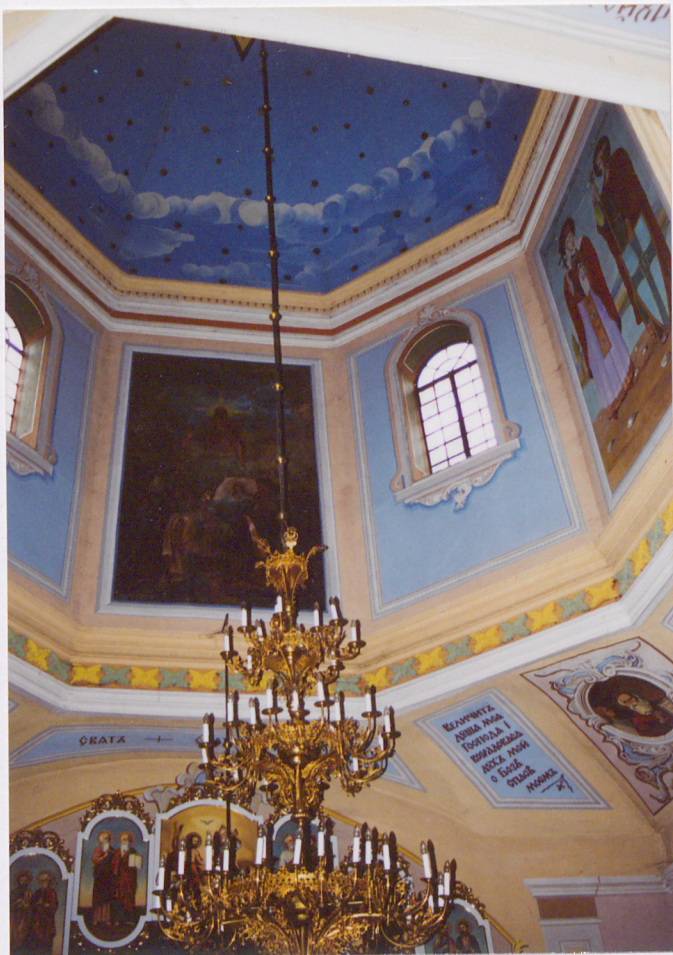
Wnętrze kopuły nad nawą