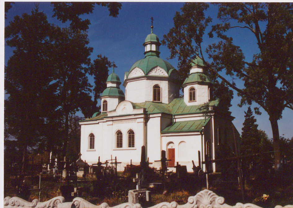
Widok ogólny elewacji południowej i cmentarza