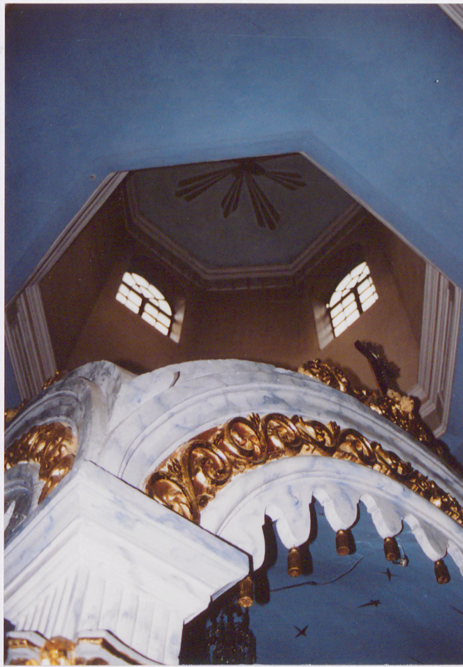
Zwieńczenie baldachimu i kopuła nad prezbiterium