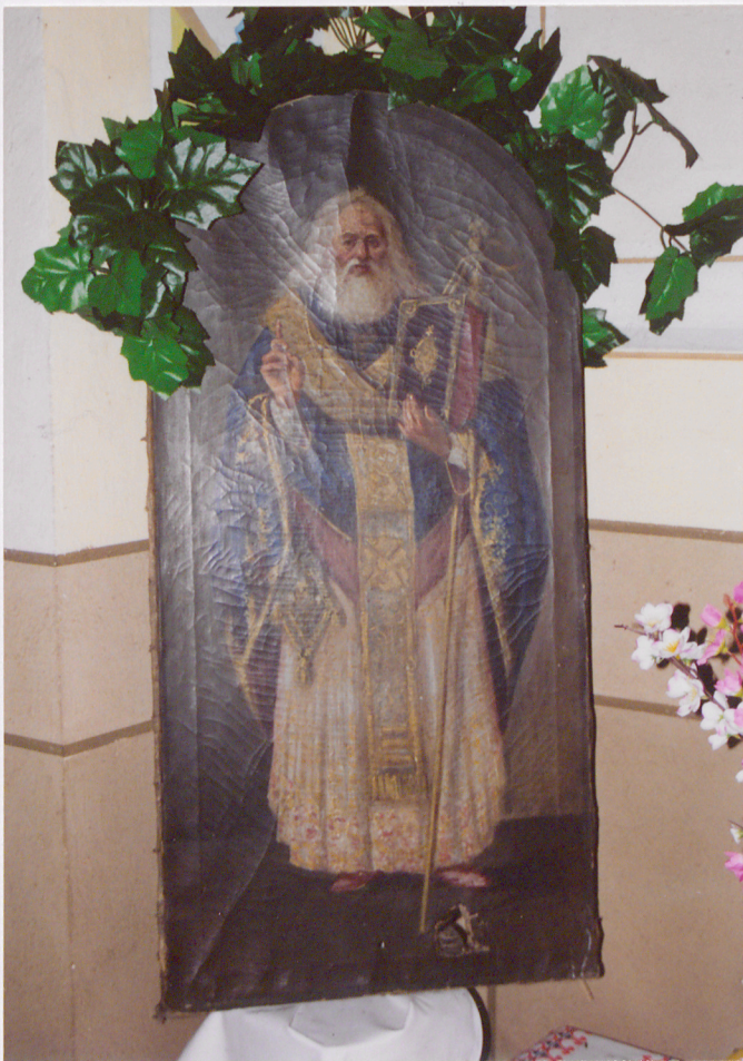
Obraz św. Jana Złotoustego /?/