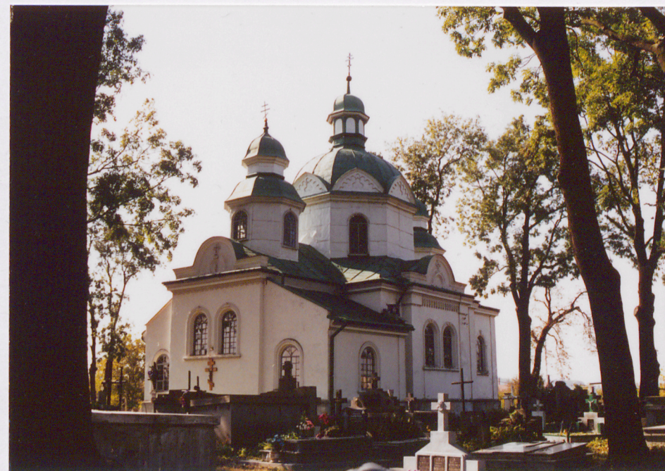
Widok ogólny od strony północno-wschodniej