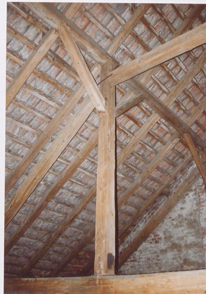
Fragment więźby dachowej

Wkładkę założył: K. Kieferling 10.2003r. (imię i nazwisko, data)