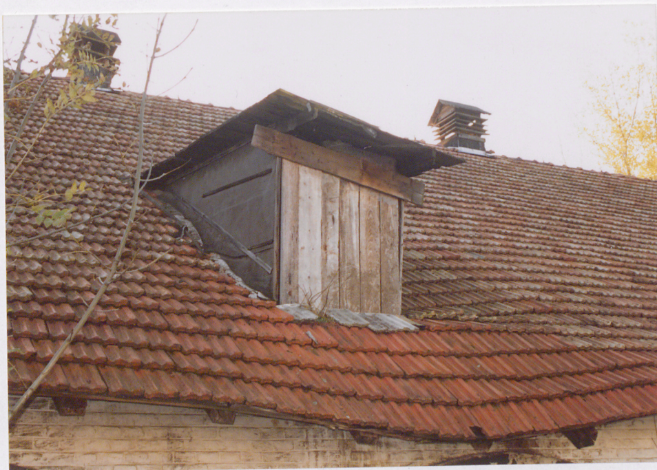
Fragment północnej połaci z "lukarną"- otworem gospodarczym.