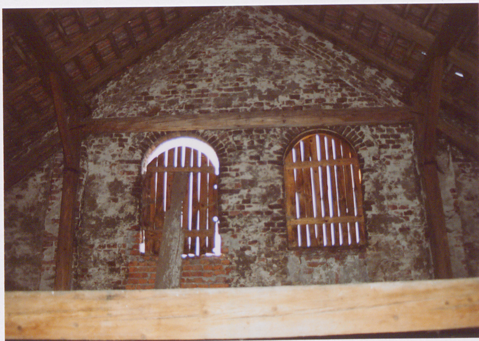
Widok ściany szczytowej na poddaszu