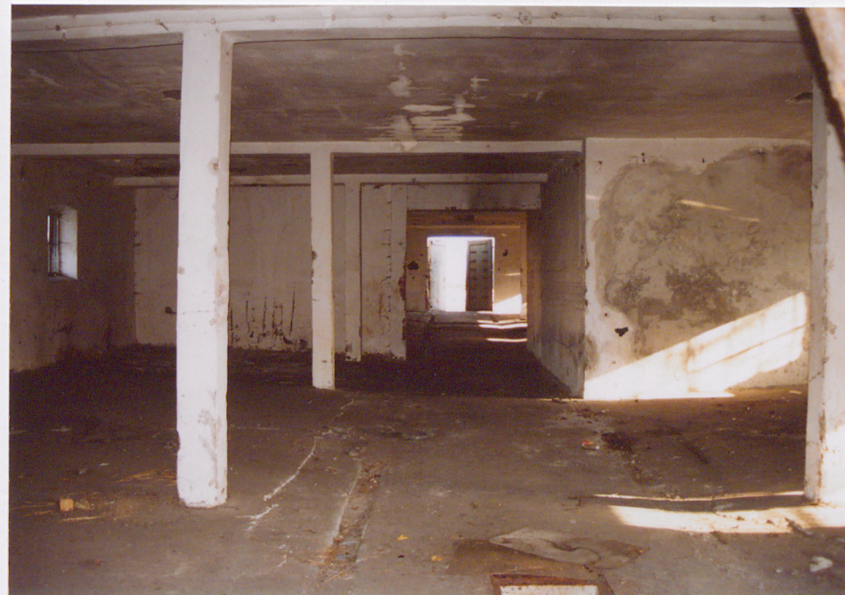
Widok ogólny wnętrza obory