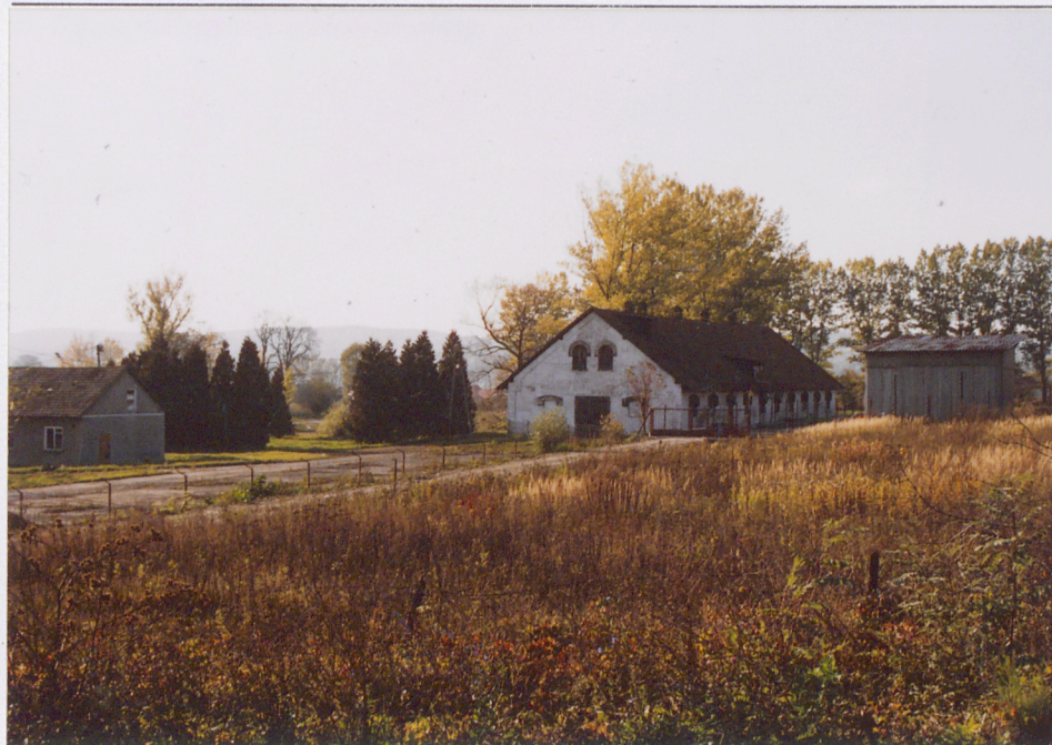
Widok ogólny obory