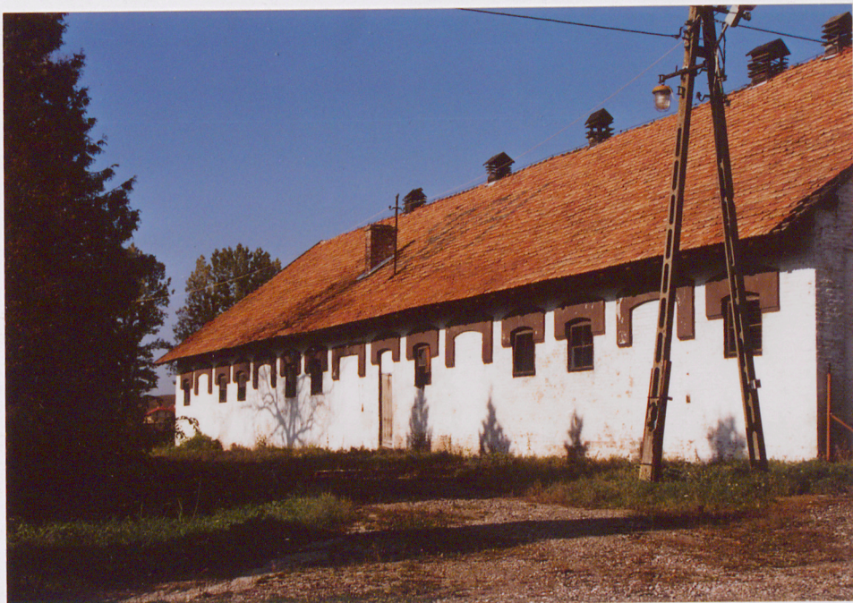
Elewacja południowa - frontowa