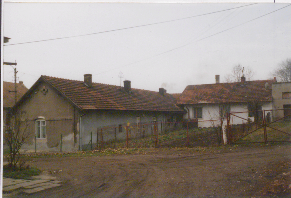
Widok od strony półn-wsch.

Budynek został wybudowany ok. 1906 r., w okresie zasadniczej przebudowy całego zespołu dworsko – folwarcznego, kiedy to na miejscu starych, drewnianych budynków powstała nowa zabudowa murowana. Rzut budynku zachowany jest na planie katastralnym – jako element aktualizacji planu dokonanej ok. 1911 r. Z okresu budowy zachował bryłę, oraz wystrój elewacji.