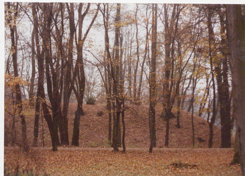
PN.-ZACH. NAROŻNIK UMOCNIEŃ