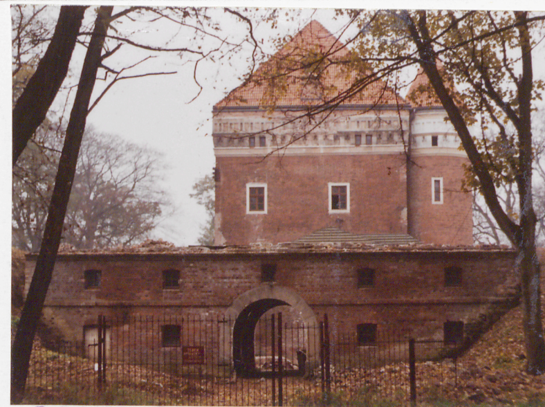
BUDYNEK BRAMNY OD PÓŁNOCY