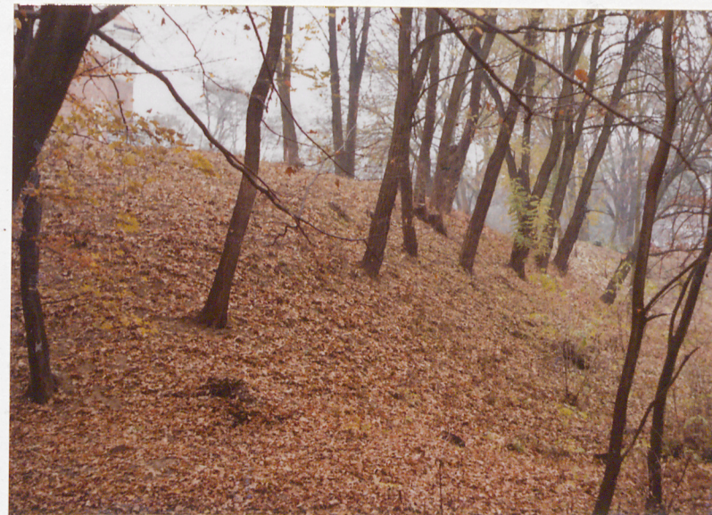
FRAGMENT UMOCNIEŃ OD ZACHODU