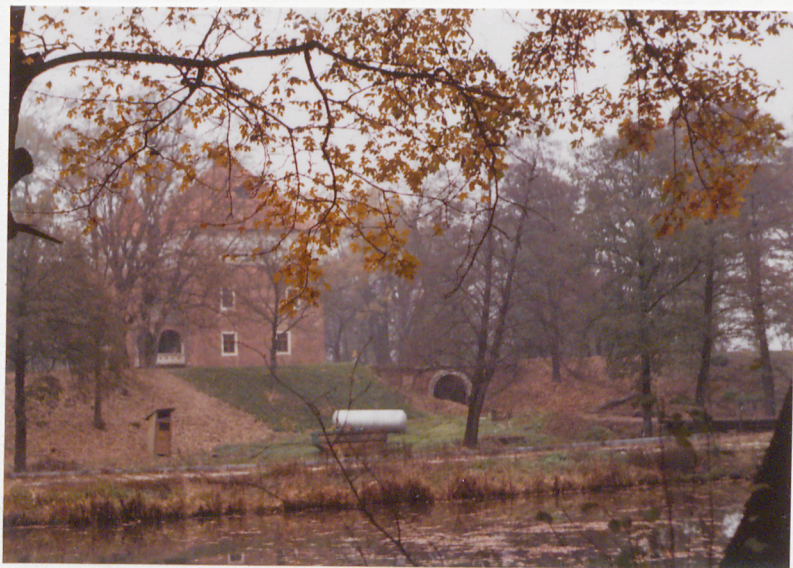
ODCINEK PD. UMOCNIEŃ Z BRAMĄ