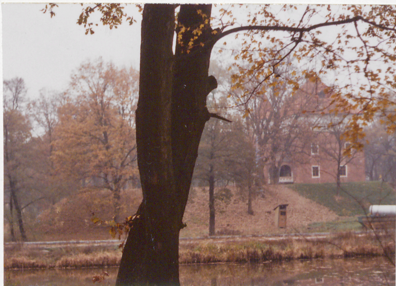
WIDOK OD PD. - ZACH.