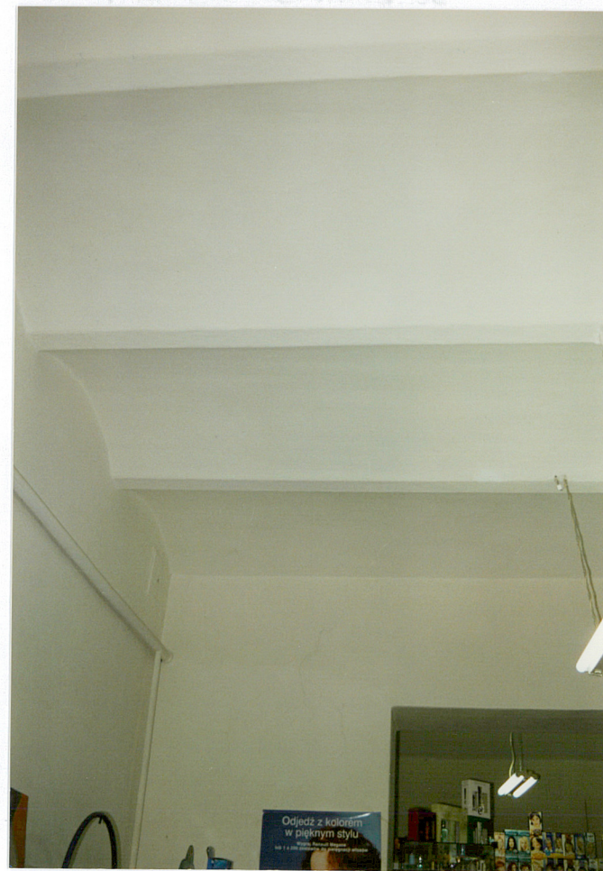
Sklepienie w lokalu handlowym