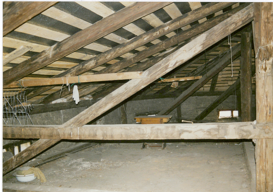
Fragment więzby dachowej