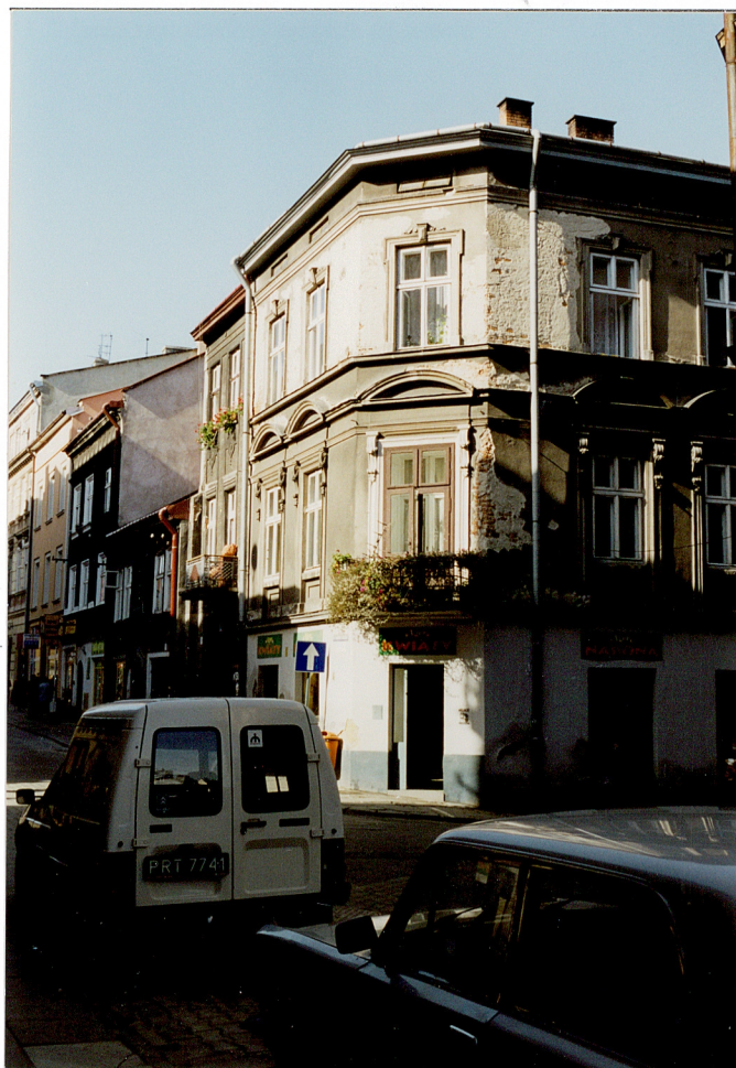
Widok ogólny od strony wschodniej