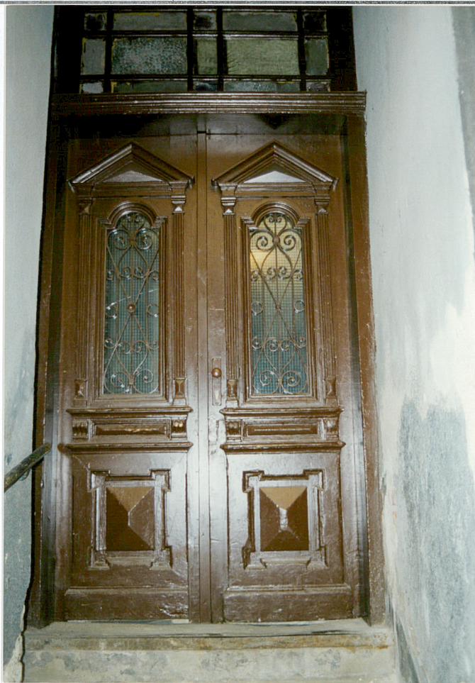
Drzwi wejściowe do sieni

3. Zawartość wkładki (nazwa obiektu lub materiału uzupełniającego) Zdjęcia