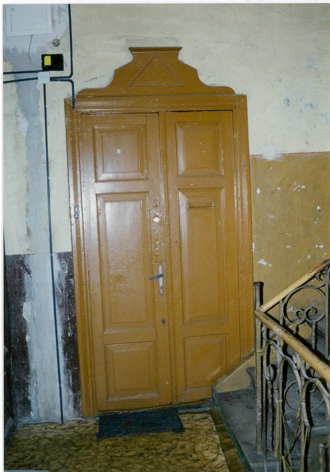
Drzwi do mieszkania na I piętrze