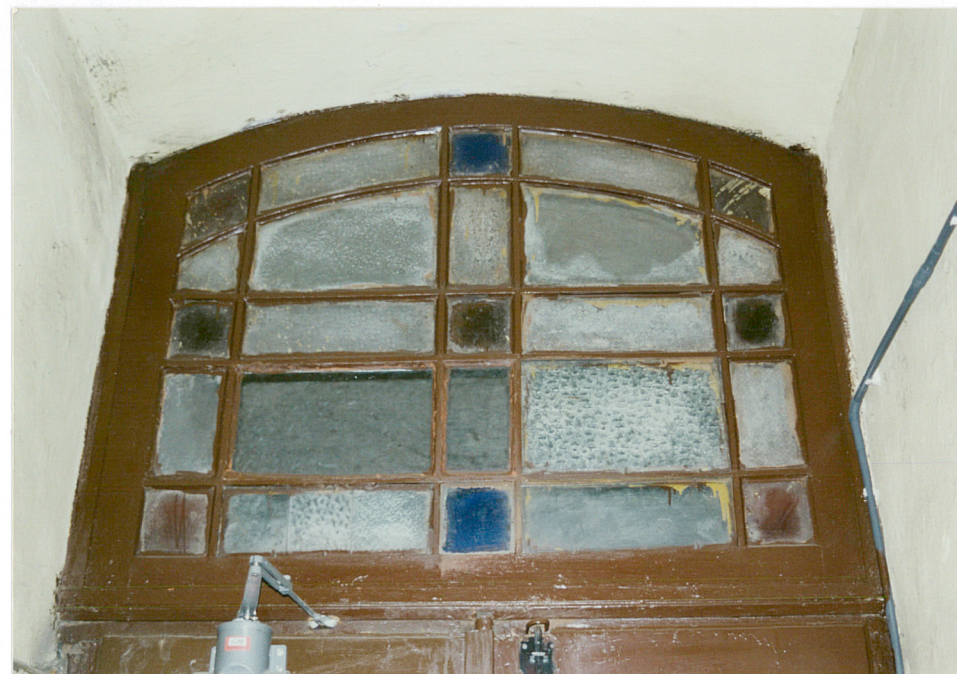
Nasłonecznik drzwi wejściowych

Wkładkę założył: K. Szuwarowski, 11.2001 r. K. Szuwarowski (imię i nazwisko, data)