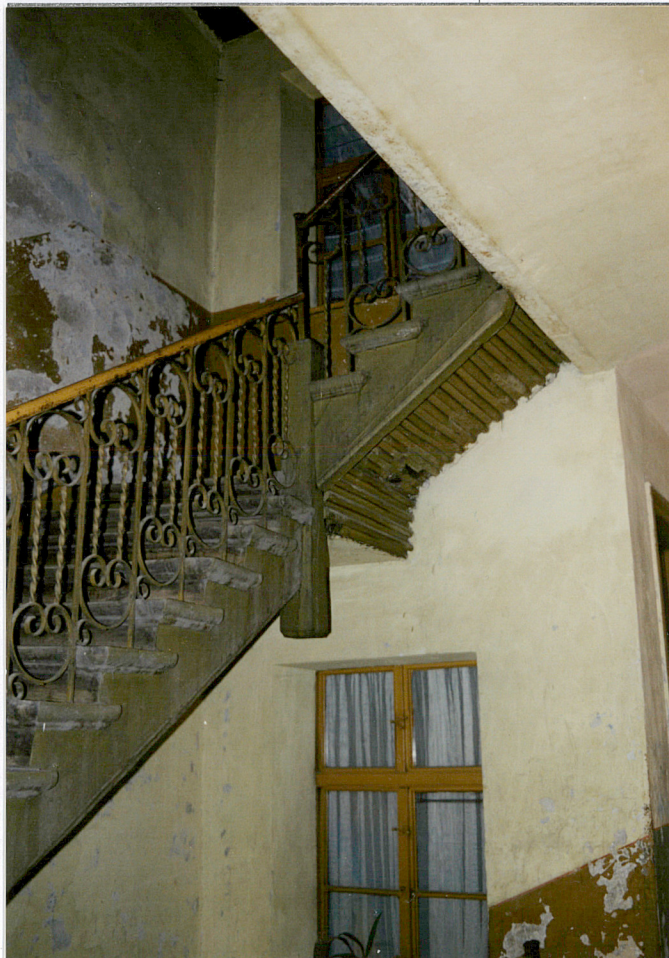
Fragm. schodów z balustradą

3. Zawartość wkładki (nazwa obiektu lub materiału uzupełniającego) Zdjęcia