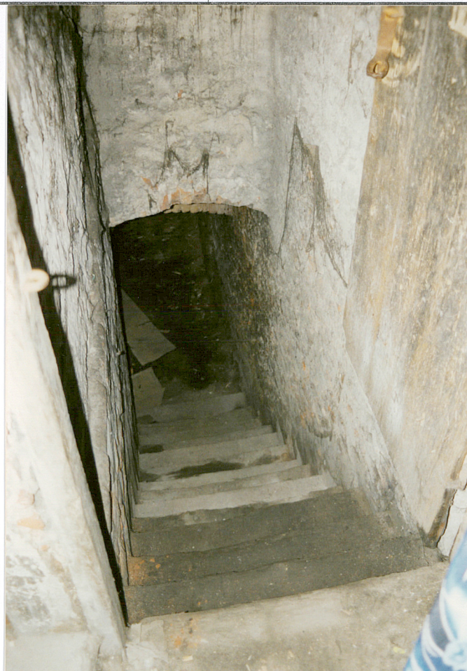
Zejsść do piwnicy