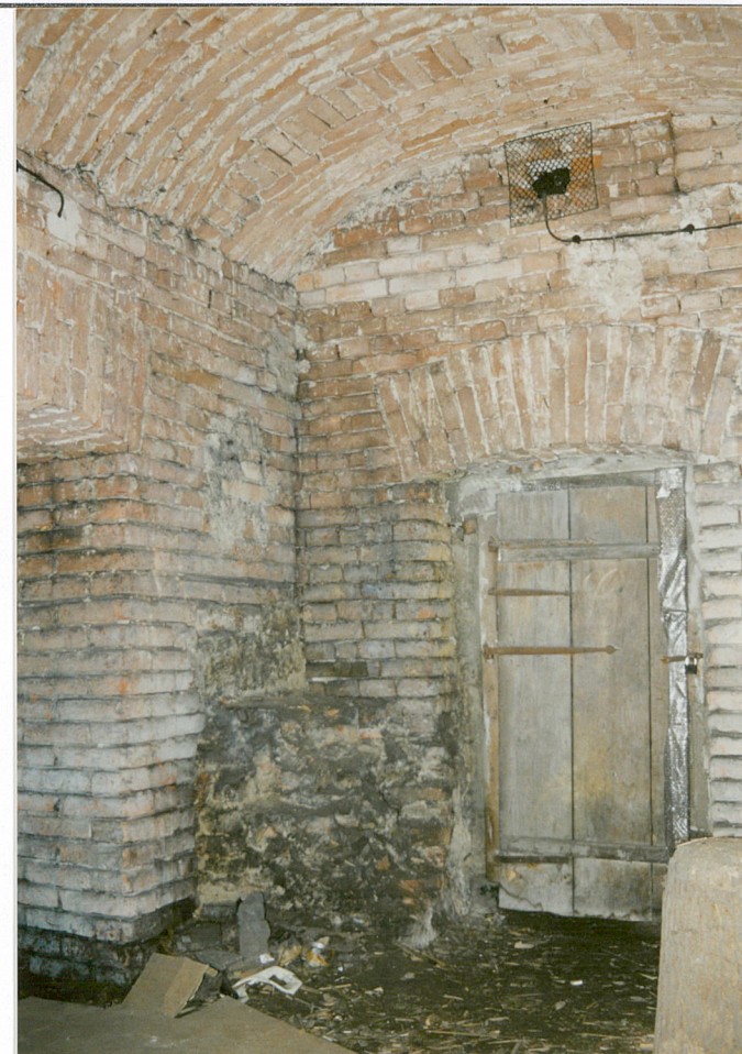
Komora piwniczna. Na pierwszym planie relikty d. zabudowy

Wkładkę założył: K. Szuwarowski, 11.2001 r. K. Szuwarowski (imię i nazwisko, data)