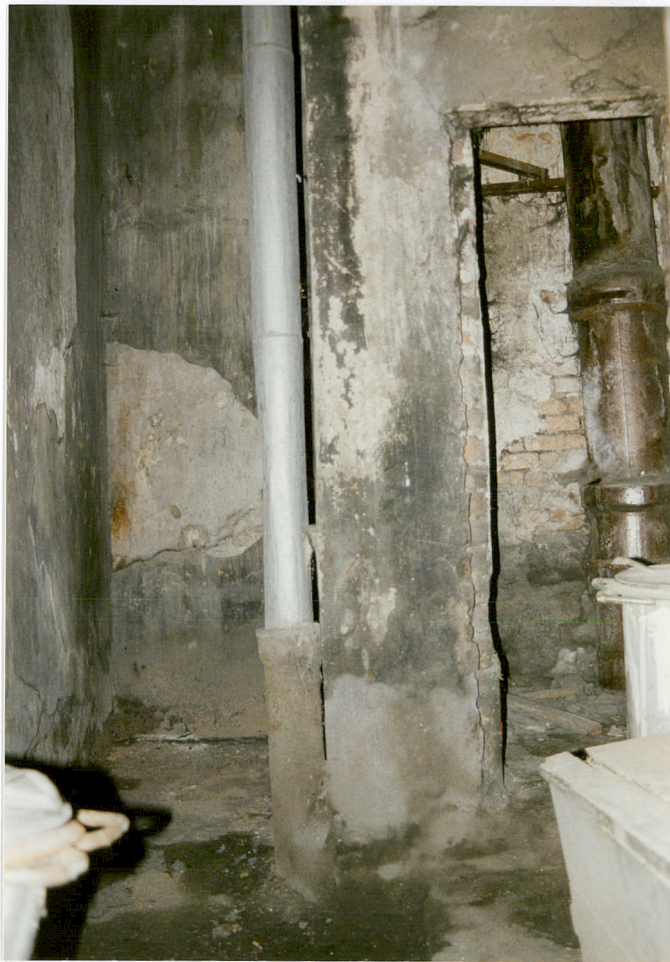
Podwórko z wieżą suchych ustępów