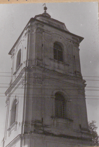
Ł. W. Strycharz. 12000 - kart.

Dzwonnica - brama wzniesiona z presbiterium kościół, w ciągu ogrodzenia, murem z cegły otynkowanej, z dekoracją architektoniczną w tech- niecej manierze, hełm pokryty blachą. Inskrypcja na murze zbliżonym do ławadzi. Dol- na kondygnacja przeznaczona na mieszkanie głównie ze stropami drewnianymi. Elewacje o naciągach opisanych pilastrami. Dolna posiada naciąg rozłożony