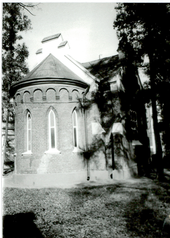
Widok kaplicy od strony prezbiterium