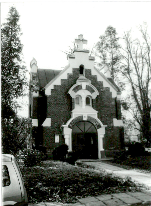
Widok elewacji frontowej