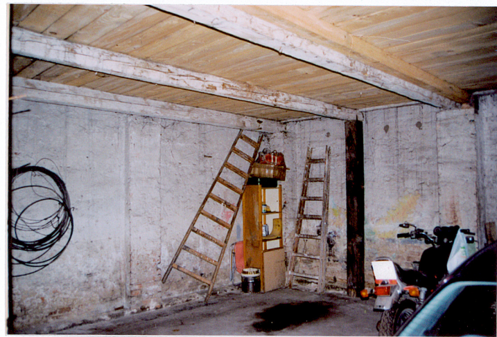
Pomieszczenie d. powozowni