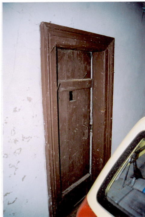
Drzwi do mieszkania stangeta