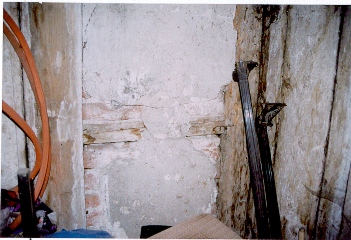
Ściana dziatowa w mieszkaniu stangeta