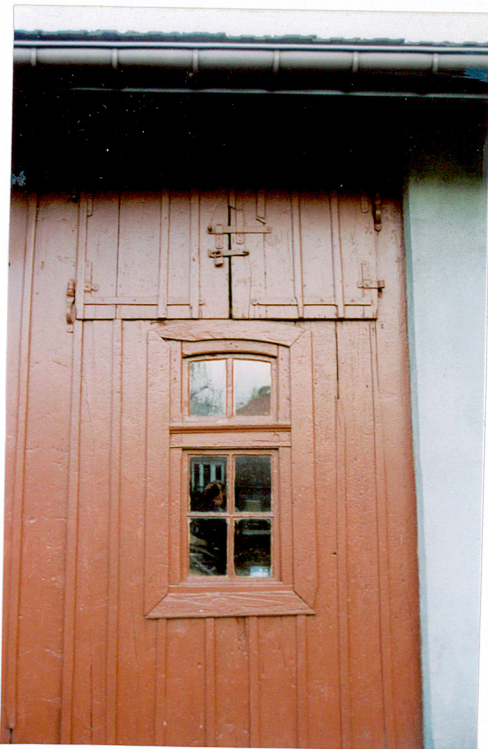
Drzwi na strych