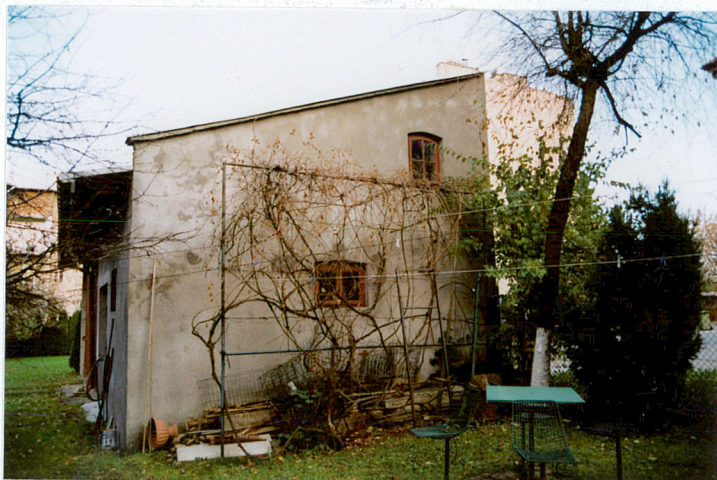
Elewacja boczna zachodnia