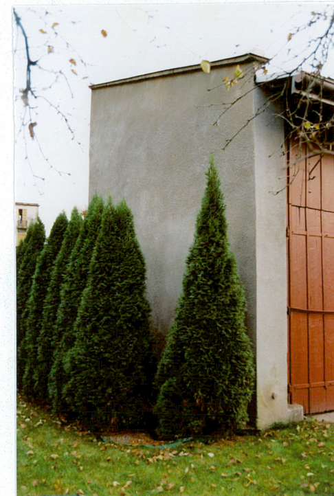
Elewacja boczna wschodnia