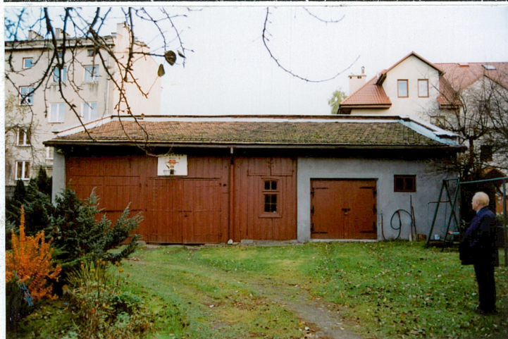
Widok ogólny budynku