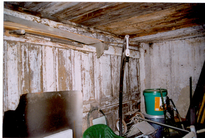
Prycinowa ściana w mieszkaniu stangeta