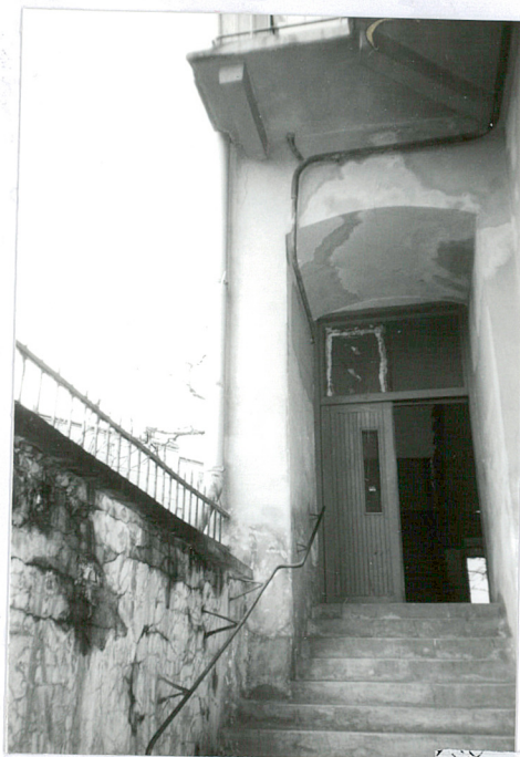
Drzwi na dziedzińcu