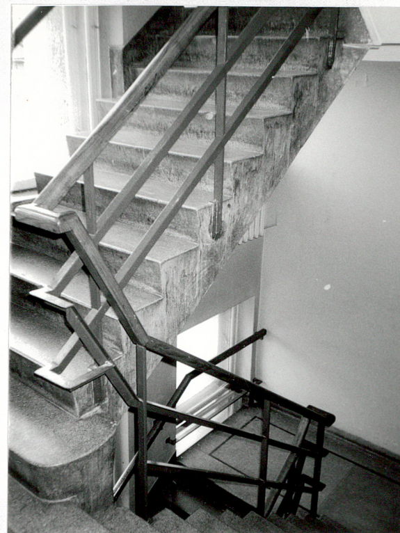
Fragment gospodarczej klatki schodowej w płn. skrzydle