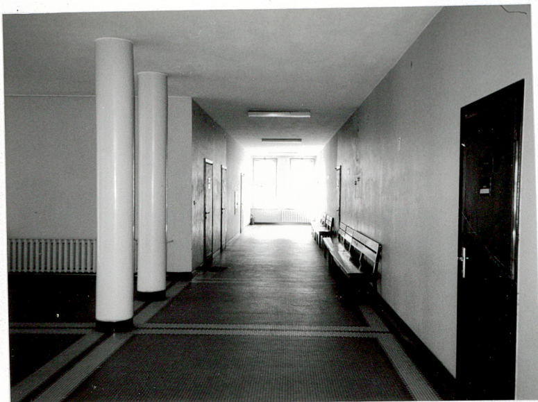
Korytarz bocznego skrzydła