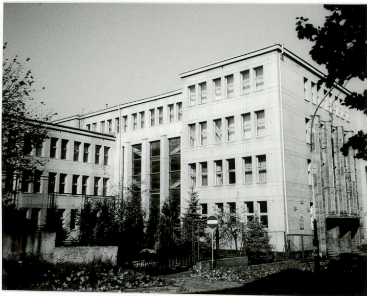
Widok ogólny gmachu Sądu od południa

11. Zdjęcia rzut przekrój sytuacja orientacja