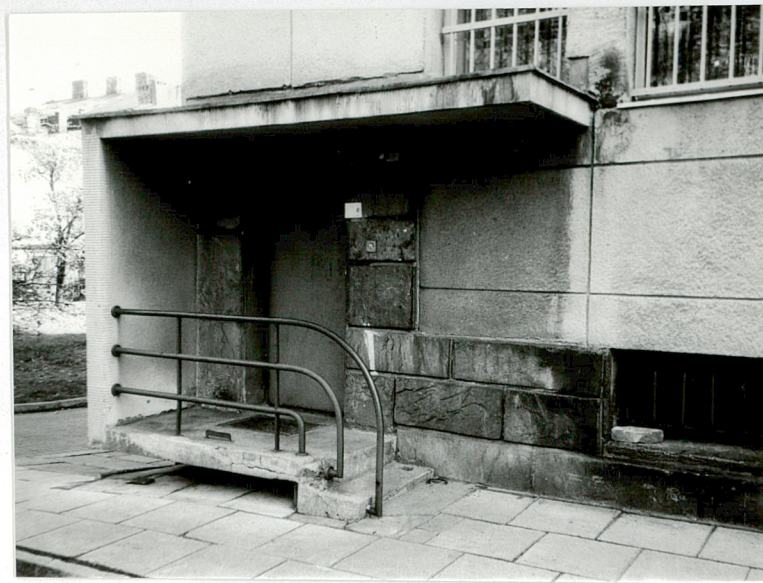
Drzwi wejściowe w tylnej elewacji