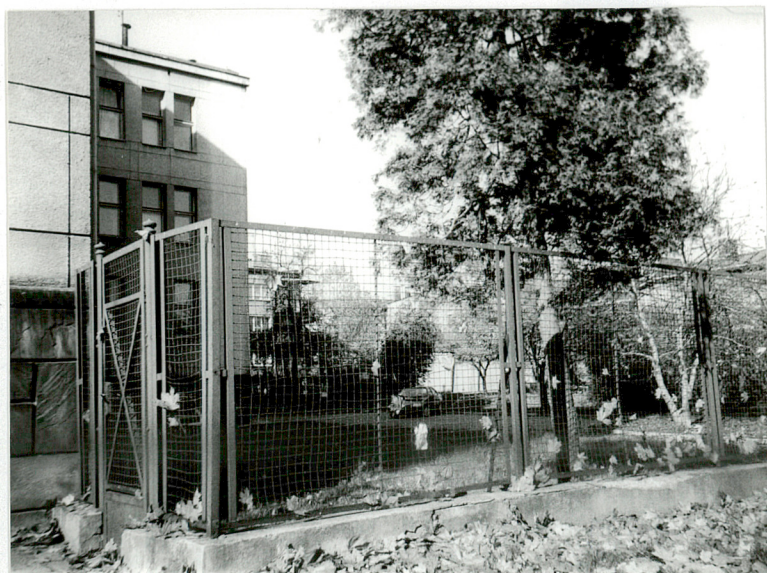
Otoczenie budynku od strony północnej