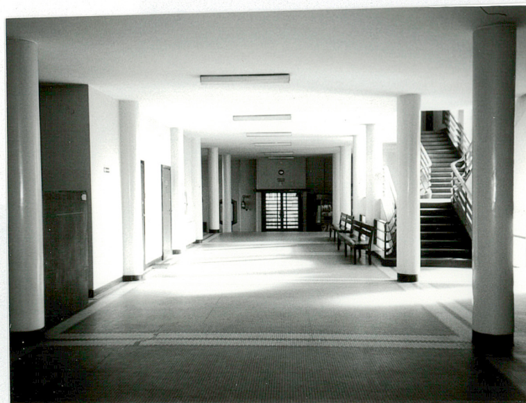
Widok ogólny holu na parterze - w kierunku wejścia