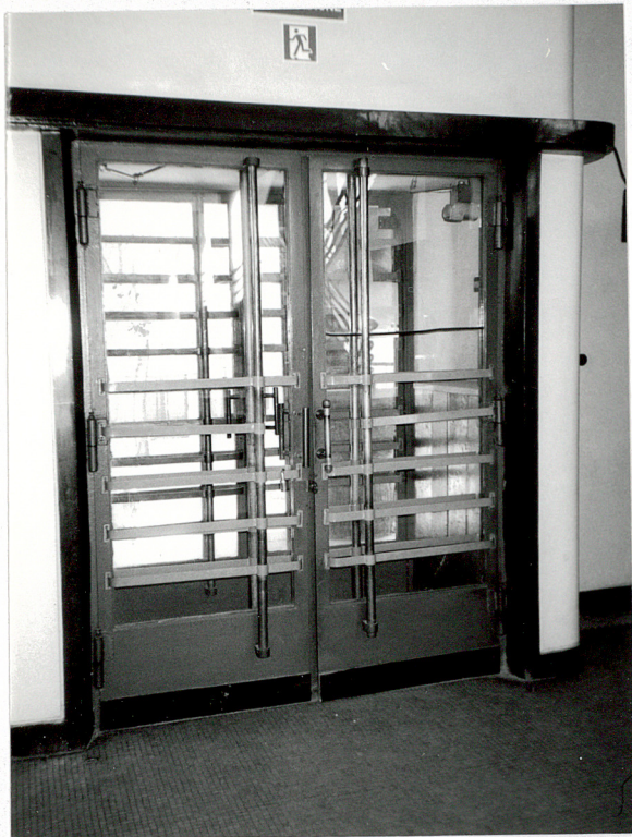
Główne drzwi wejściowe. Widok od wnętrza