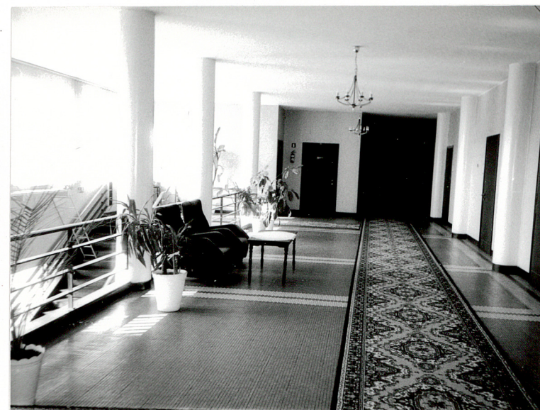
Hol piętra III.

Wkładkę założył: mgr K. Szuwarowski, 11.1998 r. K. Szuwarowski (imię i nazwisko, data)