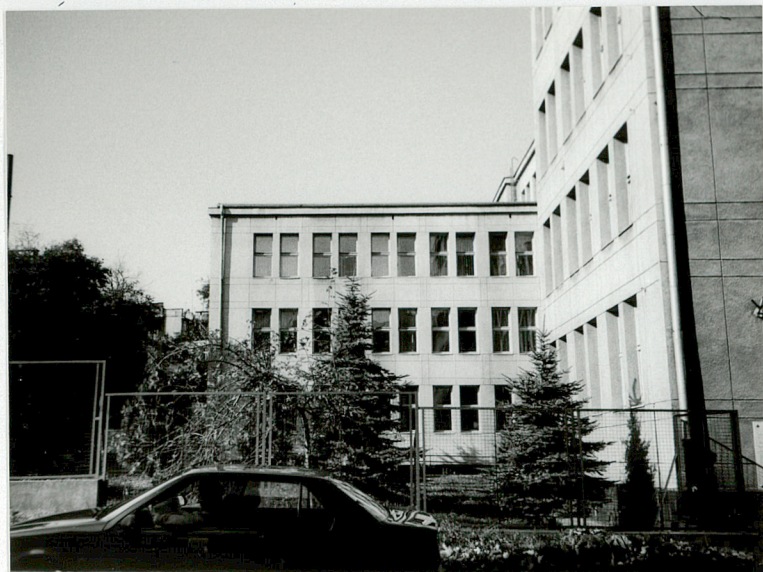
Południowe skrzydło. Widok od wschodu