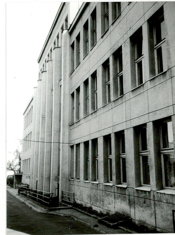
Elewacja tylna budynku

Wkładkę założył: mgr K. Szuwarowski, 11.1998 r. K. Szuwarowski