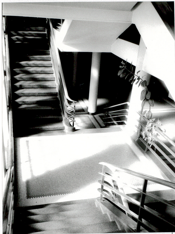
Główna klatka schodowa