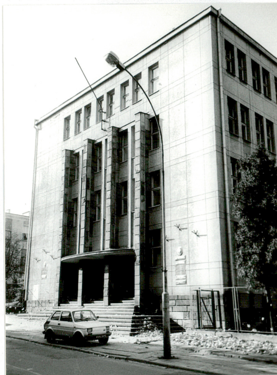
Elewacja frontowa widok od północy