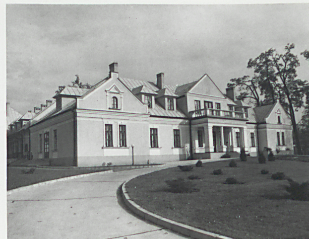
widok od płd-zach.