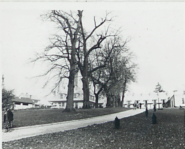
alejka dojazdowa do dworu

3. Zawartość wkładki (nazwa obiektu lub materiału uzupełniającego) Fot. dodatkowe + planik sytuacyjny.