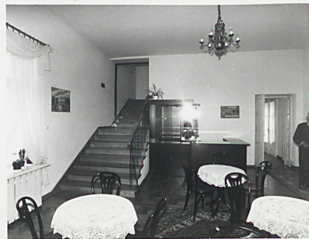
klatka schodowa na poddasze