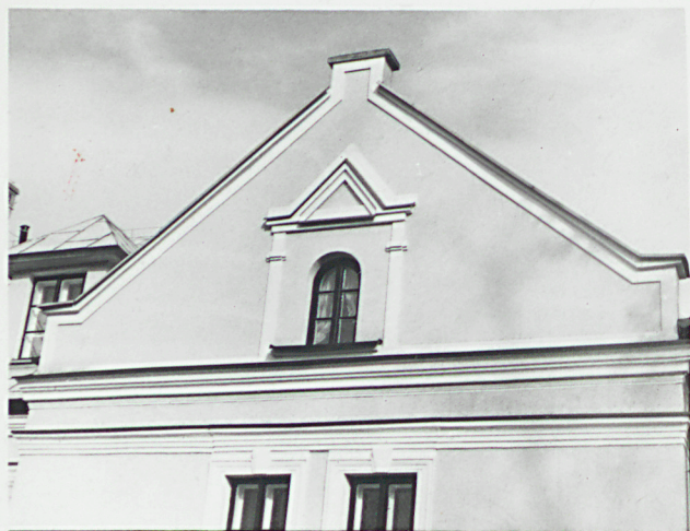
detal architektoniczny elewacji

3. Zawartość wkładki (nazwa obiektu lub materiału uzupełniającego) Fot. dodatkowe.