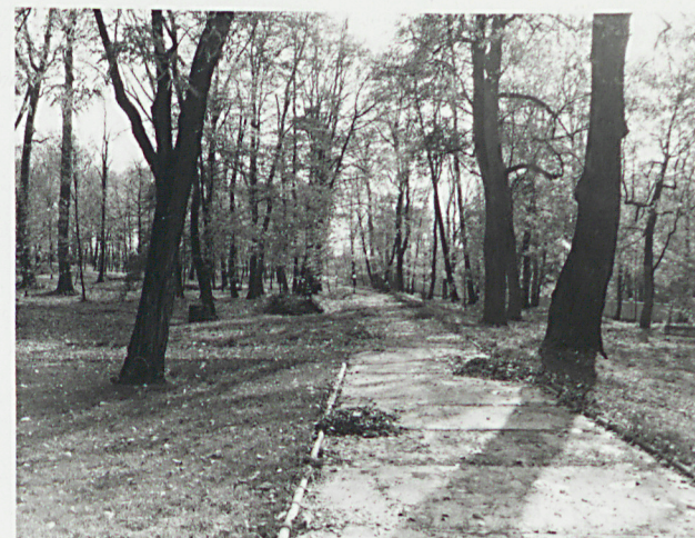
alejki spacerowe w parku