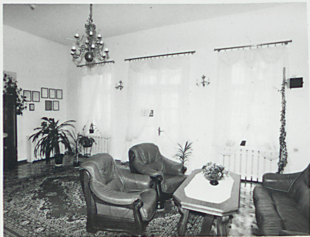
salonik w trakcie tylnym / za hallem /