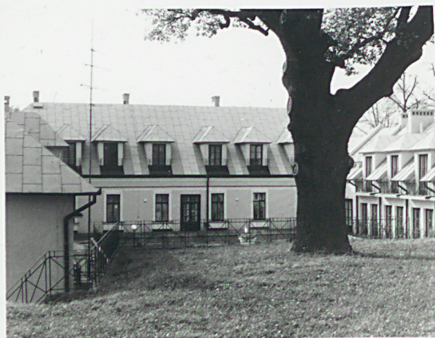
elewacja północna /tylna /