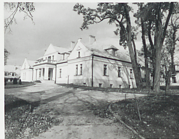
widok od płd-wsch.