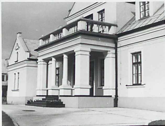
portyk z balkonem w elewacji frontowej