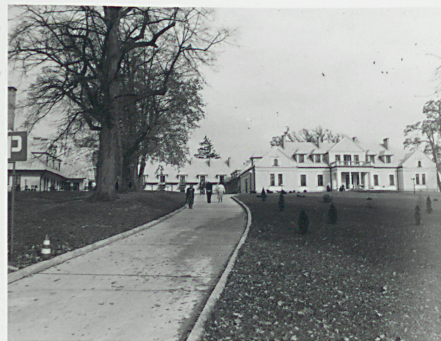
październik 1996 r.