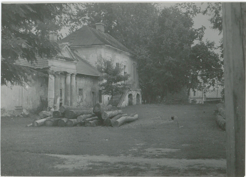
lewe skrzydło od strony podwórca fot. L. Dąbr, 1948 r.