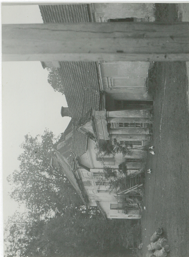
prawe skrzydło fot. L. Dąb, 1948 r.