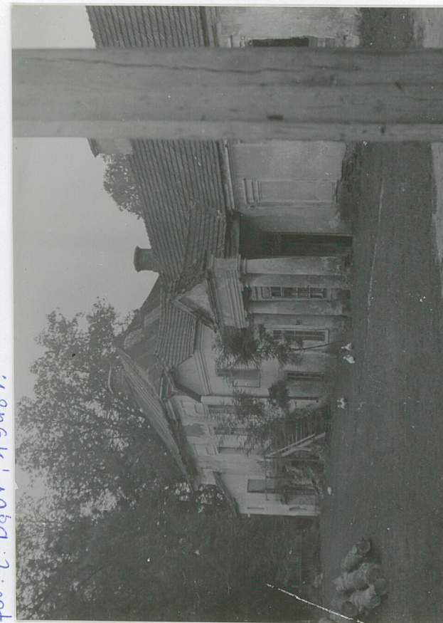
prawe skrzydło - widok od podwórza 1948 r.

Wkładkę założył: 15.07.2008 r. (imię, nazwisko, data)