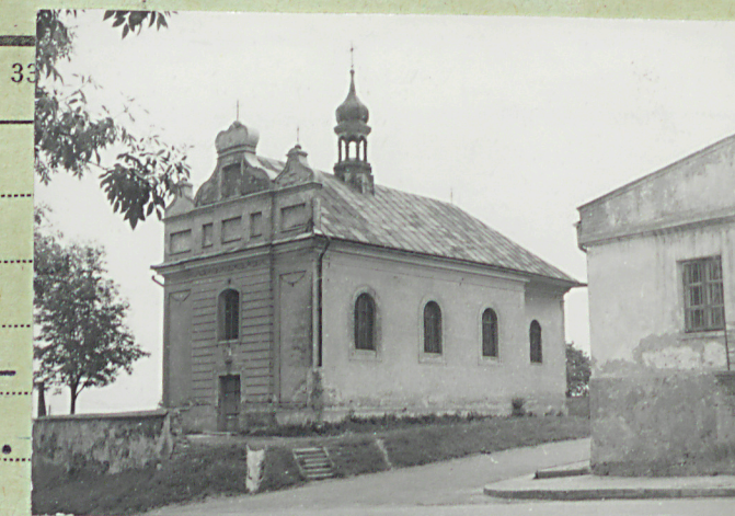
35. Uwagi różne -natrż, prostokątne, zamknięte u góry półkoliście.

Ustawiona na bastii po wsch. stronie dawnego wjazdu do miasta. Zwrócona frontem do ulicy, orientowana. Murowana z cegły, otynkowana, kryta blachą. Prostokątna, z prostokątną, nieznacznie węższą częścią najświętszą i zakrystią po stronie północnej. Dach szodłowy, trzyspadowy, z wieżyczką na sygnaturkę. Fasada trójosiowa z niewielkim ryzalitem pośrodku. Część środkowa pokryta pozornym boniowaniem. Nad prostokątnymi drzwiami wejściowymi o zgeometryzowanej dekoracji portalu z wydatnym zwornikiem w środku-supraporta z krzyżem, kotwicą, książką z literami i sercem. Nad okno, prostokątne, zamknięte segmentowo. Nad oknem główka aniołka. Całość wieńczy pełne belkowanie z główkami aniołków na fryzie. W partiach bocznych fasady płyciny z girlandami u góry. Nad belkowaniem ścianka kolankowa z rzędem wgłębionych płycin. Nad nią trzy szczyty o falistej linii-środkowy zwieńczony koroną, poniżej które w prostokątnej wnęce malowidło: Matka Boska Hodigitria. Do wnętrza drzwi dwuskrzydłowe, klepkowe, z żelaznymi ćwiekami. Wnętrze przekryte kapą xczeską na gurtach, trójpłaszczyznowe. Wzdłuż ścian nawy trzy półkoliste arkady przyścienne. Posadzka z płytek ceramicznych. Chór na trzech półkolistych arkadach. W podniebieniu chóru strop płaski. Zakrystia sklepiona kolebkowo z lunetami. Polichromia z 1901 r. Na wsch. ścianie zachowana polichromia starsza, przemalowana: kotara stanowiąca obramienie ołtarza. Okna o ościeżach rozglifionych do wew-