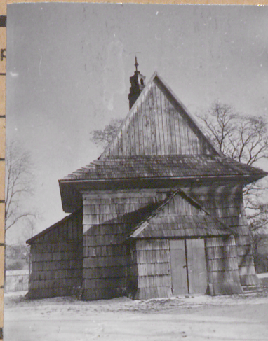
fol. B. Tondos v. 1963.