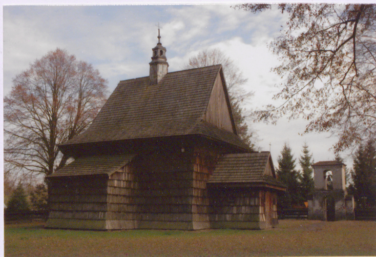
Widok na elewację frontową (zachodnią)