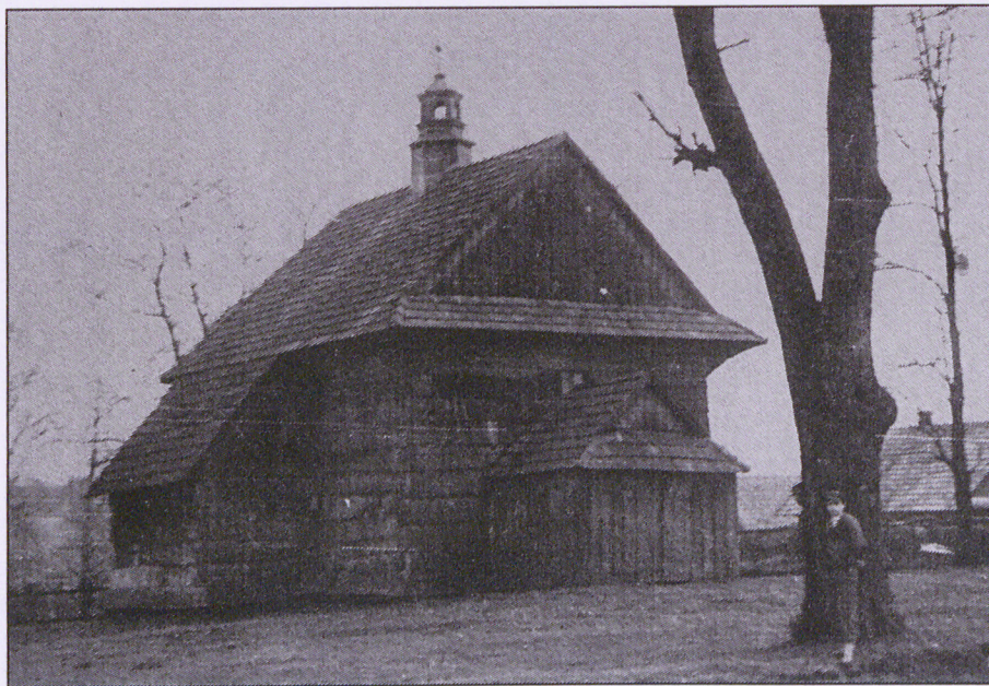
Kościół filialny w Kosinie w 1949 r.