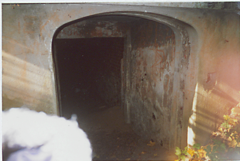
1. Wejście - przedsionek