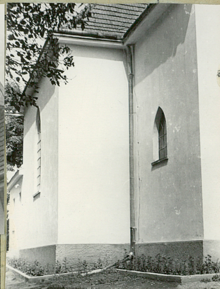
36. Wypełnił dnia VIII. 1963