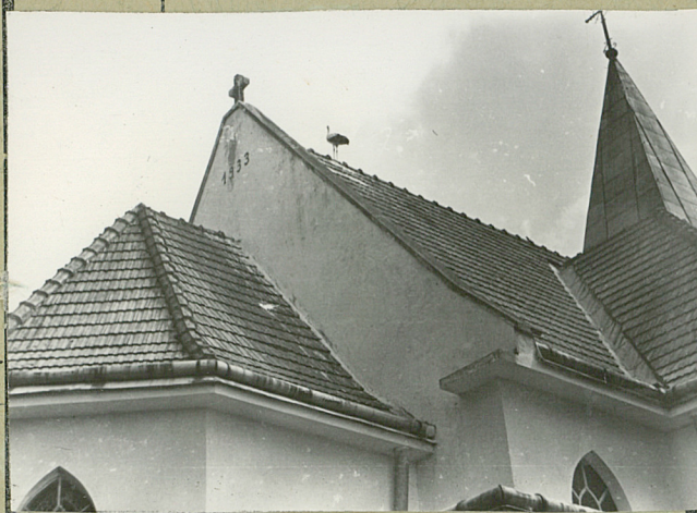
35. Uwagi różne