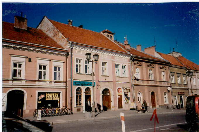
w sekcji rynekowej