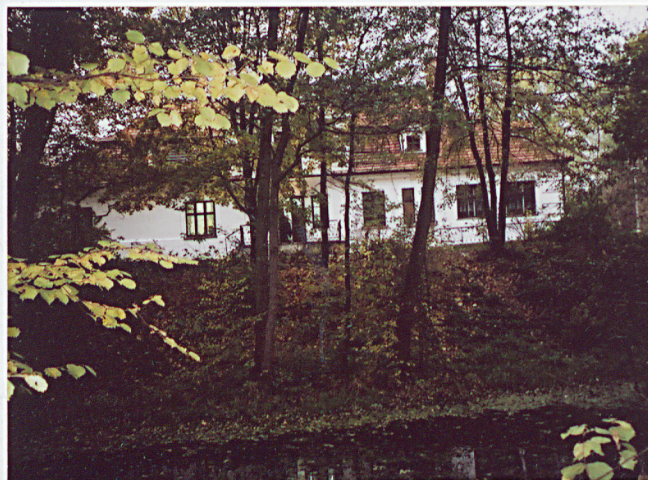
Elewacja tylna widoczna z parku z nad stawu

Wkładkę założył: Przemysław Tyjko Miejsce przechowywania negatywów: u autora