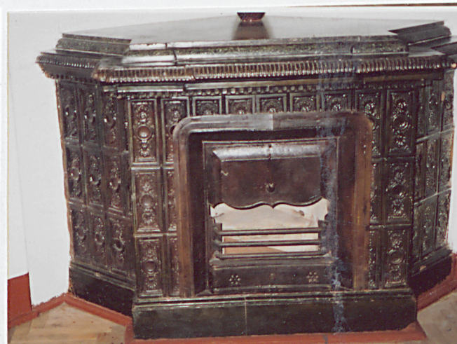
Kominek na parterze