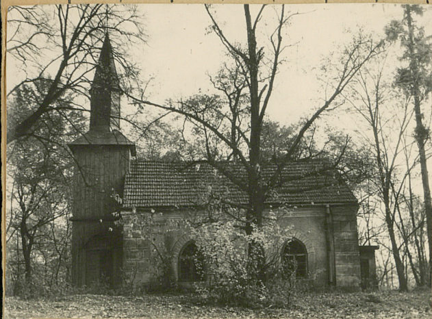
uwagi opisowe, fotografia