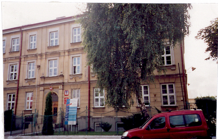
elewacja północna - frontowa