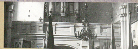
36. Wypełnił dnia uzupełnił XI. 1958