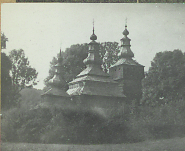
agi opisowe, fotografia

D. cerkiew usytuowana - na w odł. ok. 60m od szosy do kotłosa, w otoczeniu starych drzew, orientowana, wzniesiona na piaskach - łowej podmurówce pokrytej gontowym farkuszałicem, zwężo- wana z drzewa, oszalowana pionowo