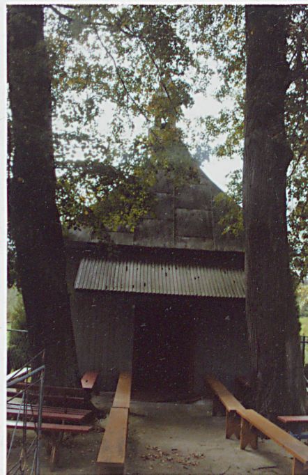
2. ELEWACJA FRONTOWA WSCHODNIA