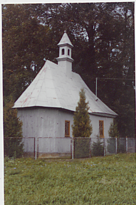
1. WIDOK NA ELEWACJE POŁUDNIOWĄ I ZACHODNIĄ