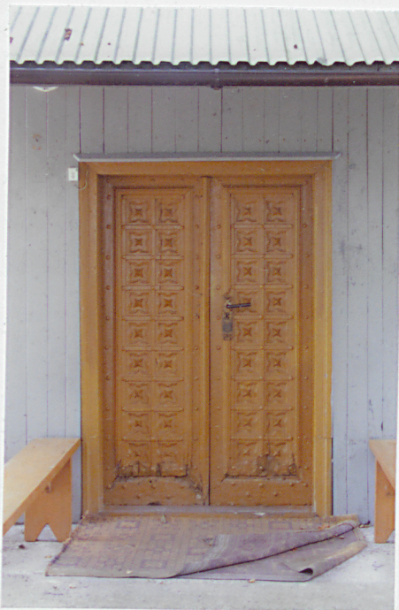
3. NEOGOTYCKIE DRZWI WEJŚCIOWE