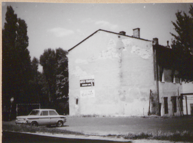
2. Elewacja boczna - zachodnia