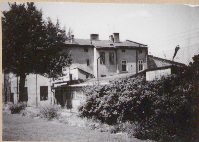
1. Elewacja tylna

3. Zawartość wkładki (nazwa obiektu lub materiału uzupełniającego)