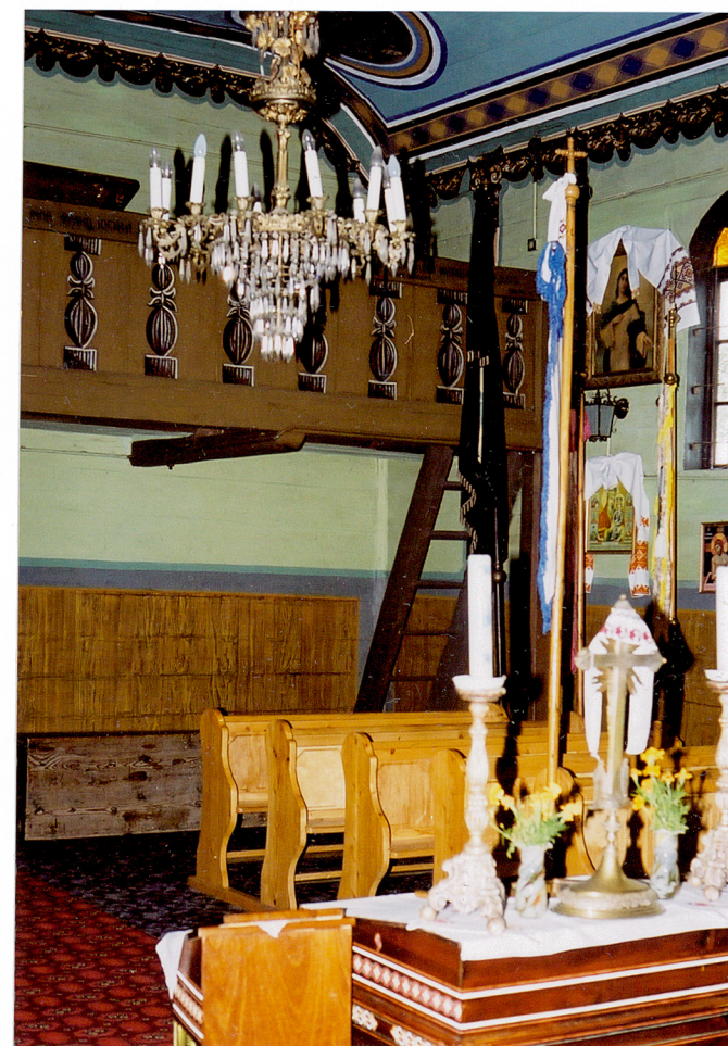
Północno-zachodnia część nawy

Wkładkę założył: ..... Jarosław Giemza 30.10.2002. (imię, nazwisko, data)