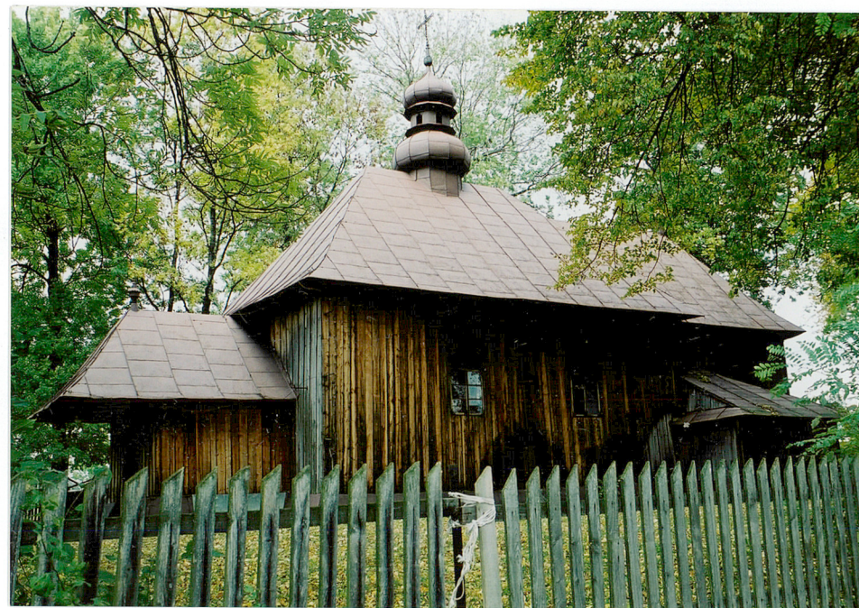
Widok od południowego-zachodu

Wkładkę założył: Jarosław Giemza 30.10.2002. (imię, nazwisko, data)