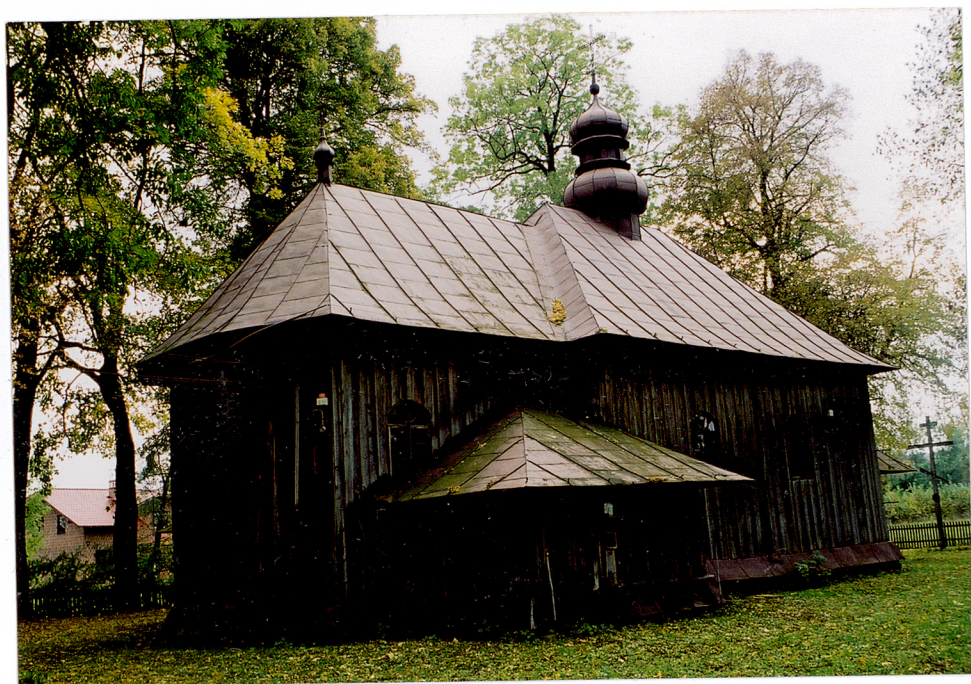
Widok od północnego -wschodu