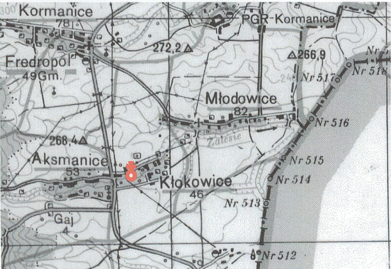
Plan orientacyjny 1 : 50 000