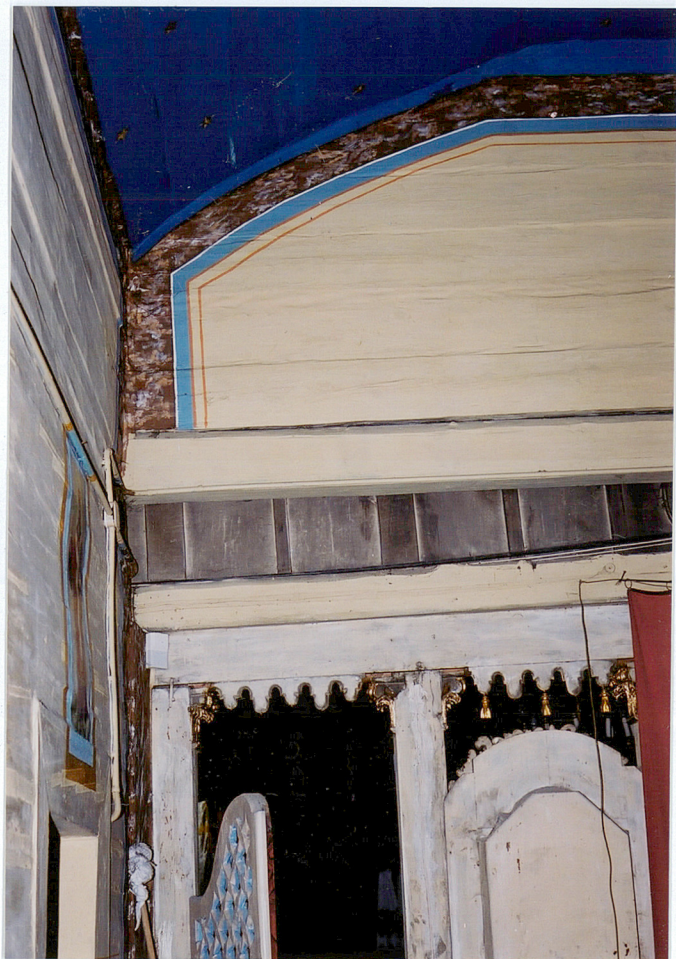
Zachodnia część sanktuarium