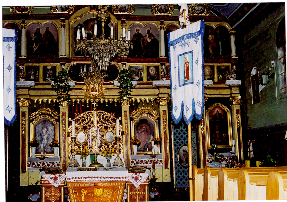
Wschodnia część sanktuarium