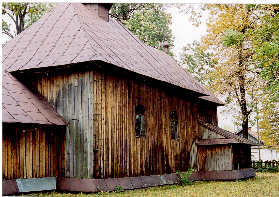
widok od południowego-zachodu