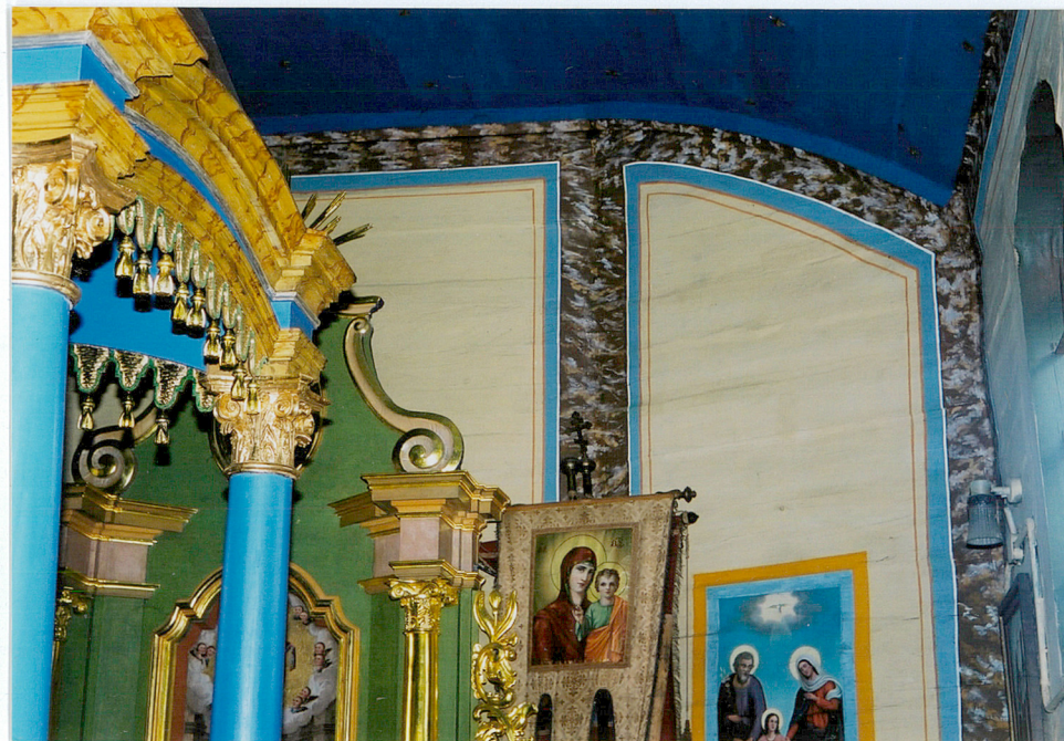
Wschodnia część sanktuarium