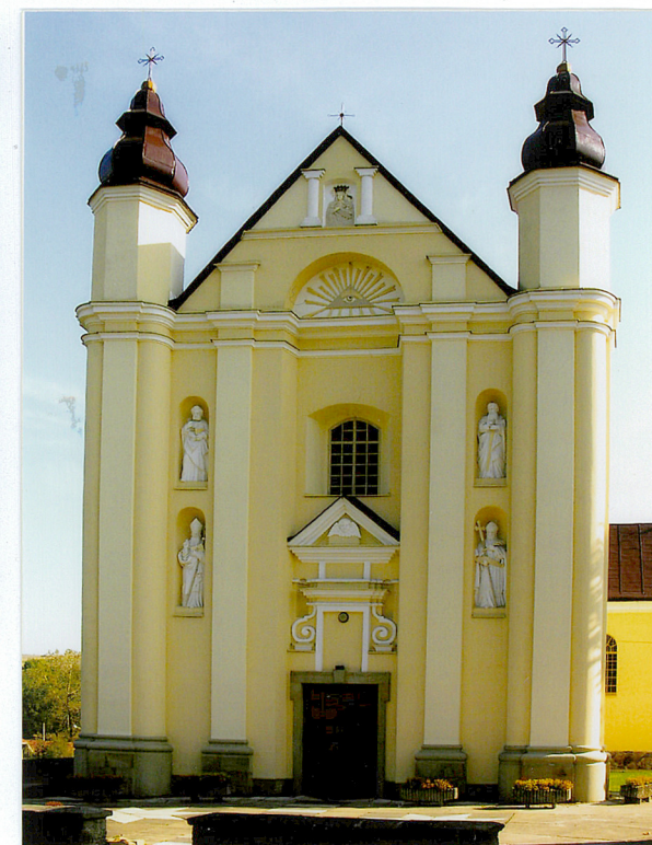
3. Fasada główna