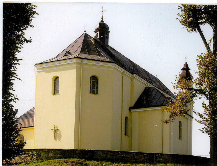
2. Prezbiterium, kaplica północna