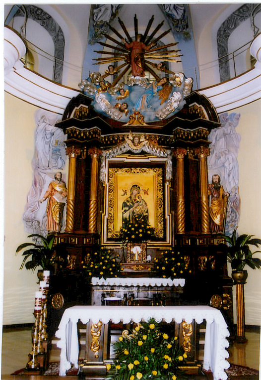
6. Ołtar główny