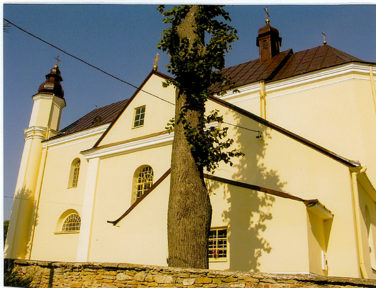
1. Elewacja od południa