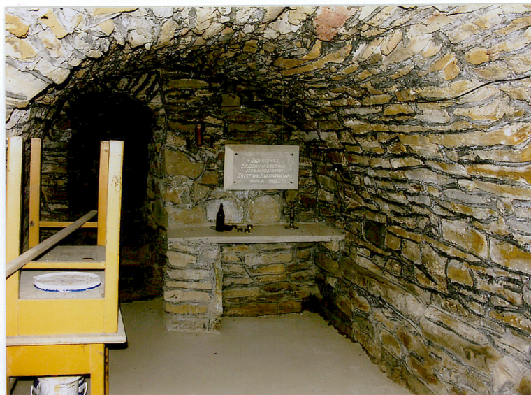
5. Krypta pod prezbiterium