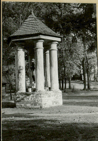
7 - 12000 - kart.