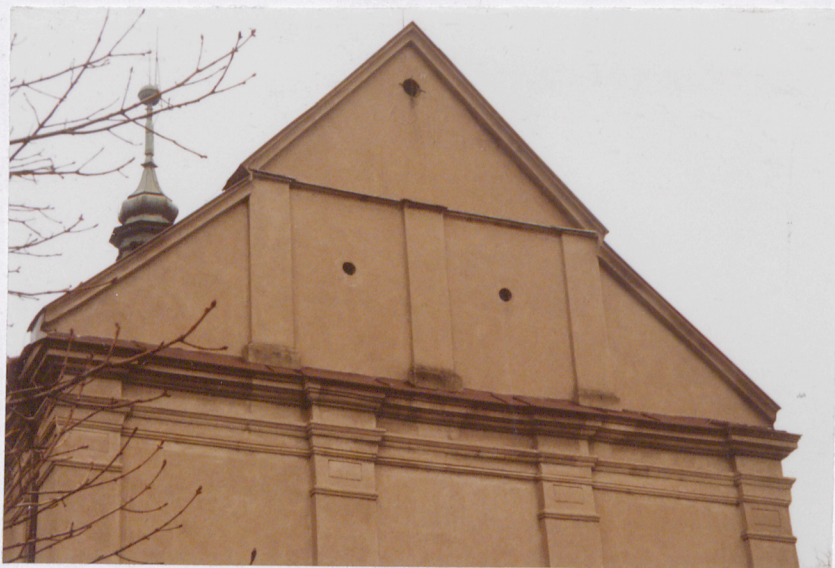
SZCZYT FASADY ZACHODNIEJ