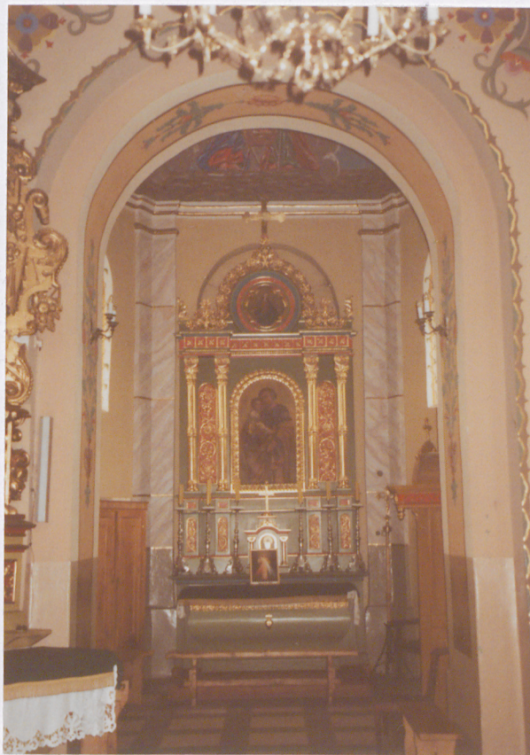
WNĘTRZE KAPLICY ŚW. JÓZEFA