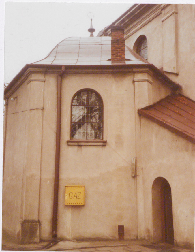
KAPLICA P.W. ŚW. ANNY