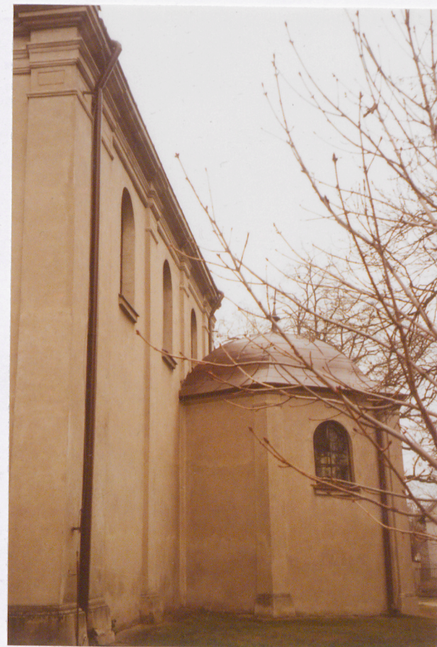
KAPLICA P.W. ŚW. JÓZEFA