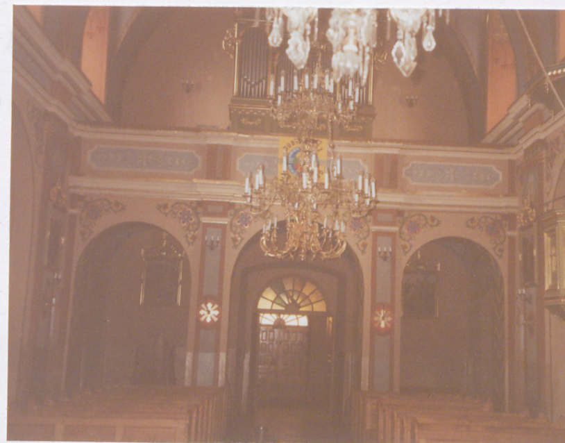
WIDOK W STRONĘ CHÓRU MUZYCZNEGO