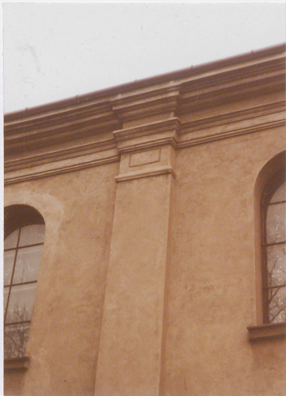
FRAGMENT GZYMŚU I OPILASTROWANIA