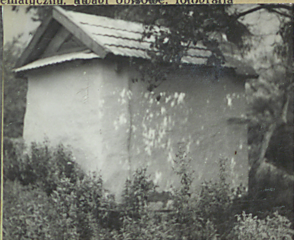
Kapliczka domkowa usytuowana przy szosie Nienadowa - Syfeczyna