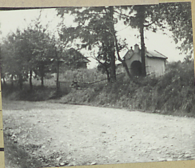
35. Uwagi różne

kolebki w ścianie tylnej półkole końcowo wsch.