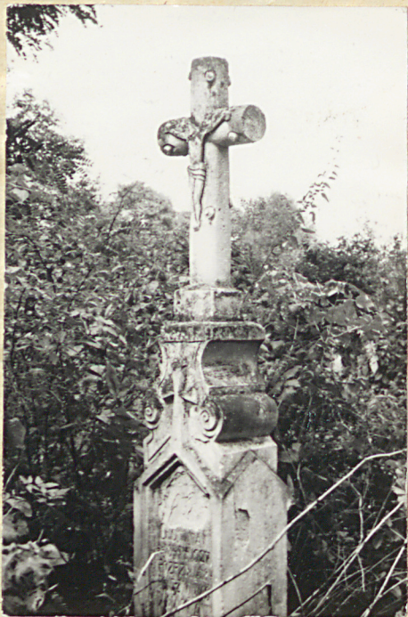
5. Nagrobek piaskowcowy, napis nieczytelny, 1027 r,