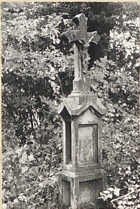
1. Nagrobek kamienny, brak napisów, pocz.XX w.