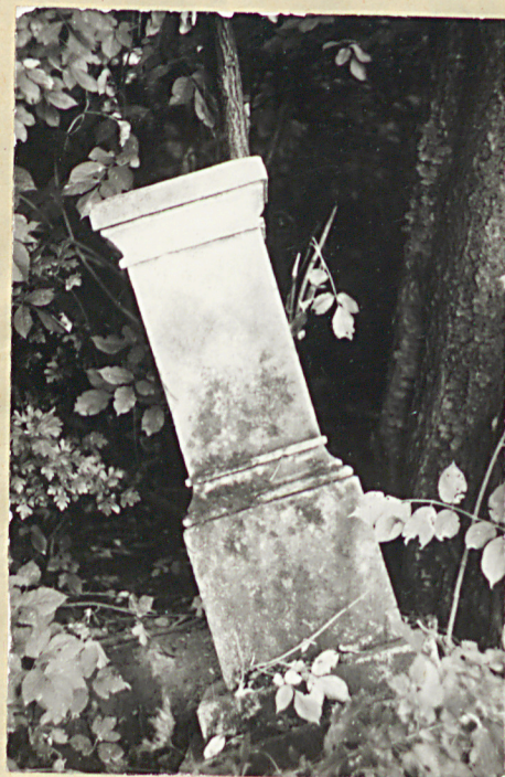
4. Nagrobek piśkowcowy, uszkodzony, brak napisów, pocz.XX w.