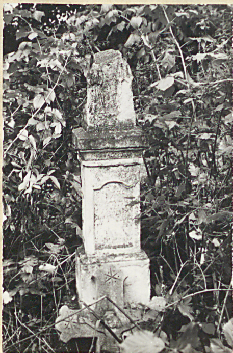
6. Nagrobek piaskowcowy, uszkodzony, napis nieczy- telny, pocz. XX w.