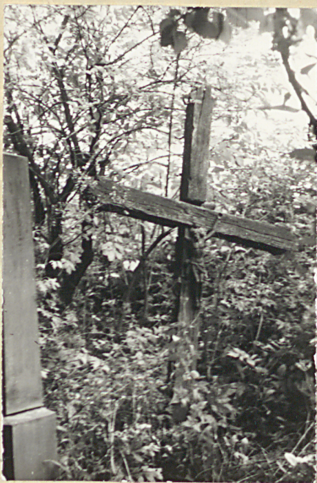
3. Krzyż drewniany, brak napisów, pocz.XX w.