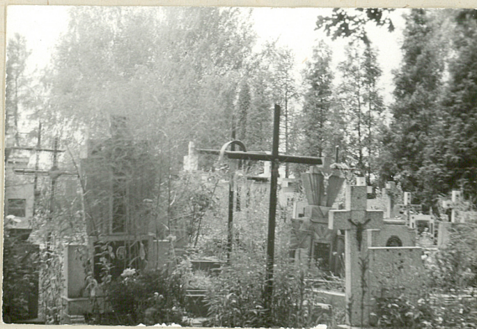
8. część nowsza cmentarza