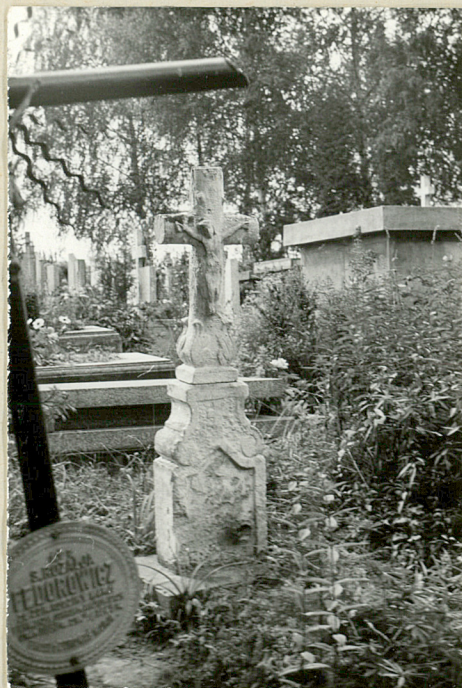
6. nagrobek kamienny bruśnieński pocz. XX w. napis nieczytelny