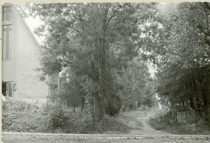
1. aleja wiodąca z drogi do cmentarza