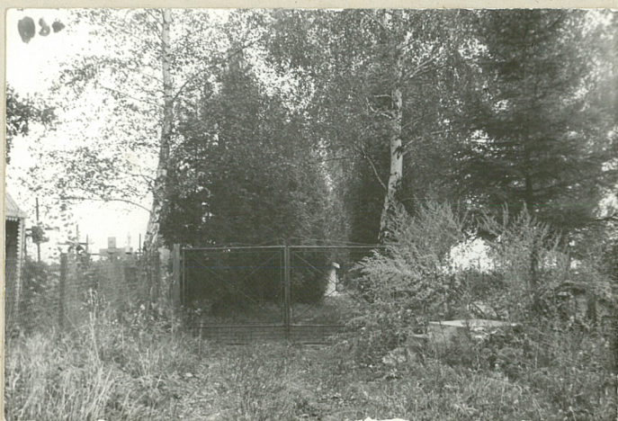
2. brama wejściowa cmentarza