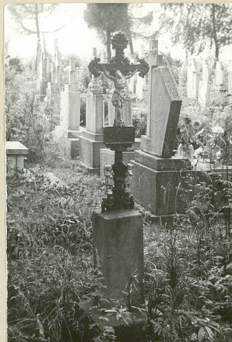
5. krzyż żeliwny pocz. XX w. napis nieczytelny