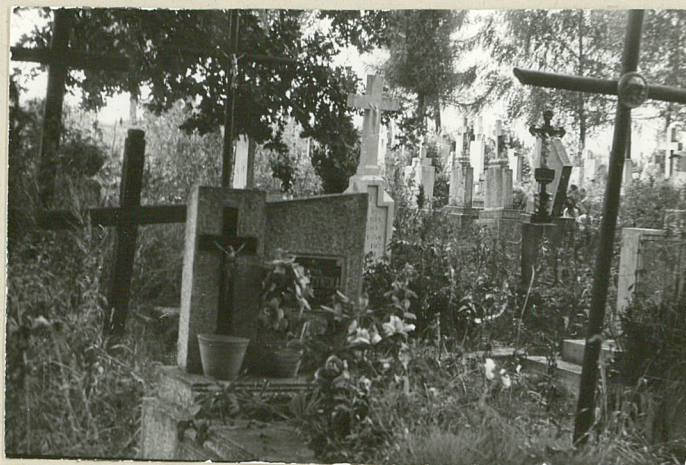
7. widok na starszą część cmentarza