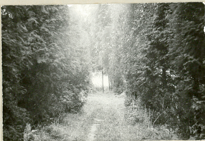
3. aleja cmentarna