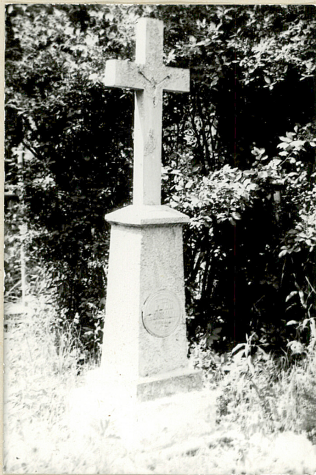
5. Nagrobek kamienny Iwan Kozłowski zm. 1921r.