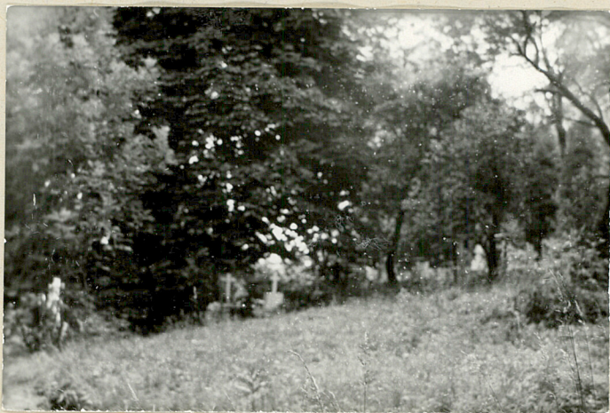
7. Widok ogólny na część środkową.