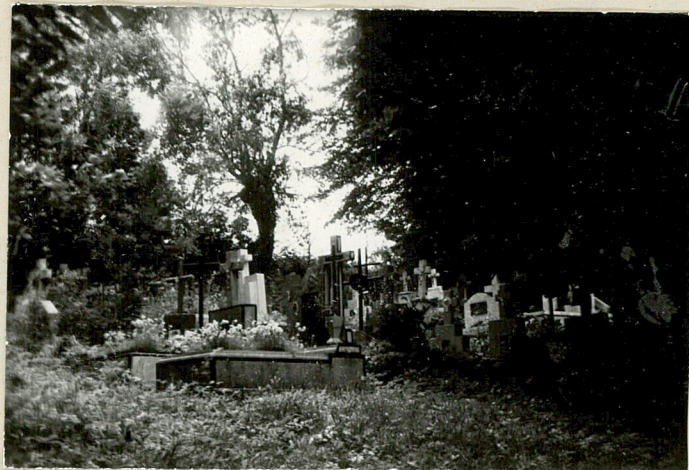
6. Widok ogólny na część wsch.