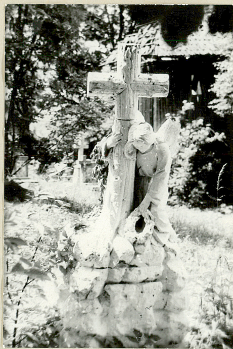
4. Nagrobek kamienny z pocz.XXw. (napisów brak).