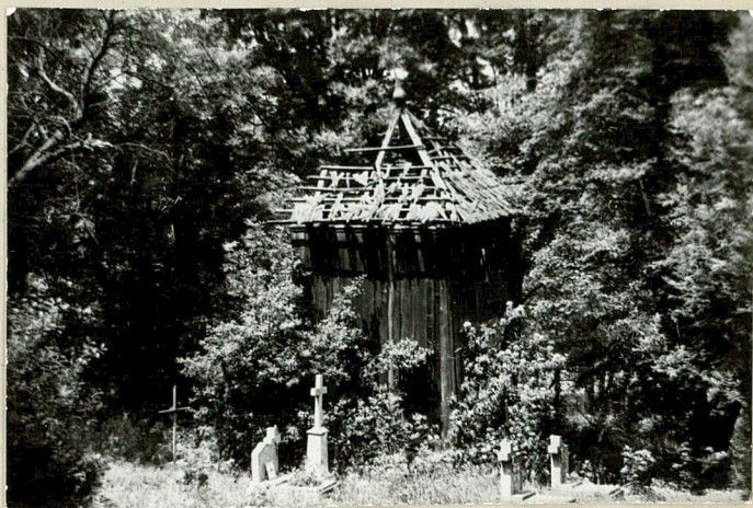
2. Drewniana dzwonnica.