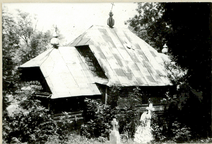
1. Cerkiew drewniana z 1856r.