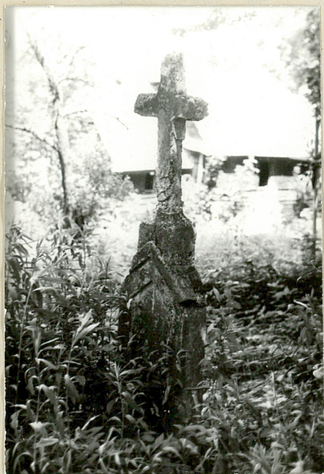
3. Nagrobek kamienny z pocz.XXw. (napis nieczytelny).