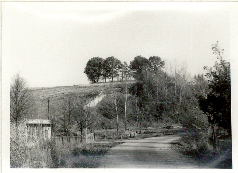
1. Widok od strony drogi