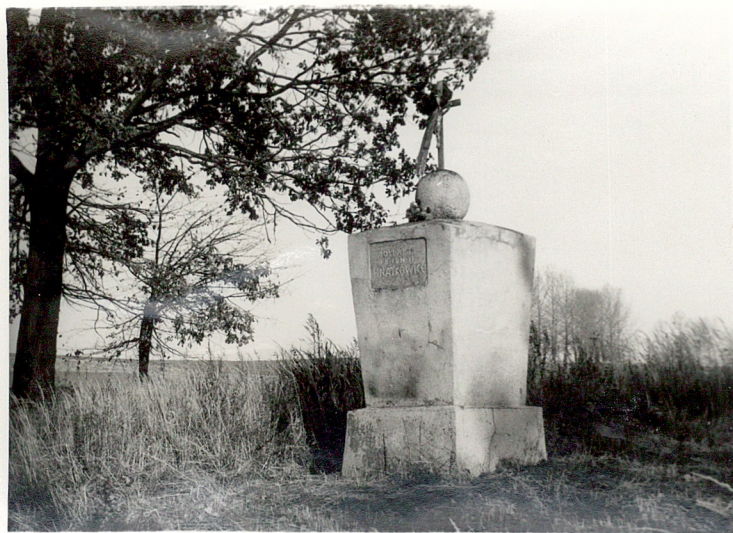
3. Pomnik z napisem "IOOESTERREICH-UNGARICHE /SOLDATE/UND 126 RUSSISCHE - SOLDATEN"