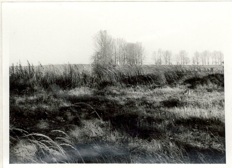
2. Układ mogił