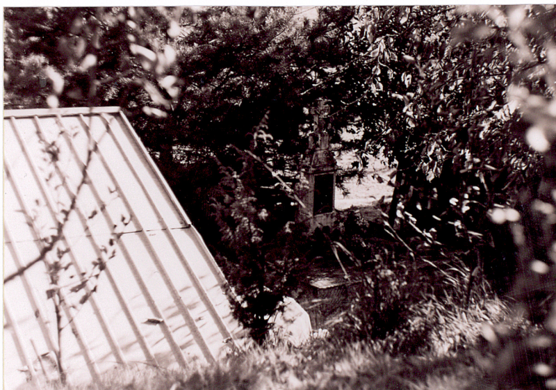
1. Nagrobek mieszkaniec Zielonki rozstrzelanych w 1915r. (6 osób)