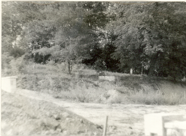
1. Widok ogólny