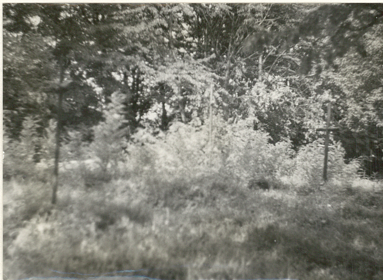
3. Widok na półn.-wsch. część