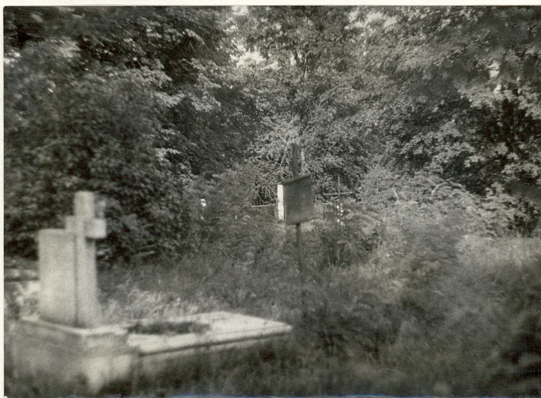
2. Widok na środkową część