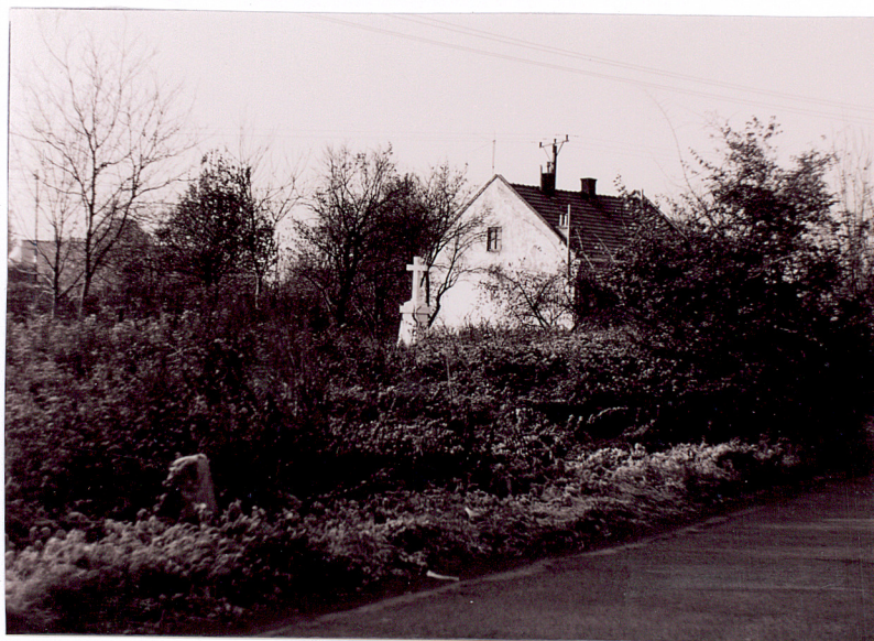
1. Widok od strony drogi