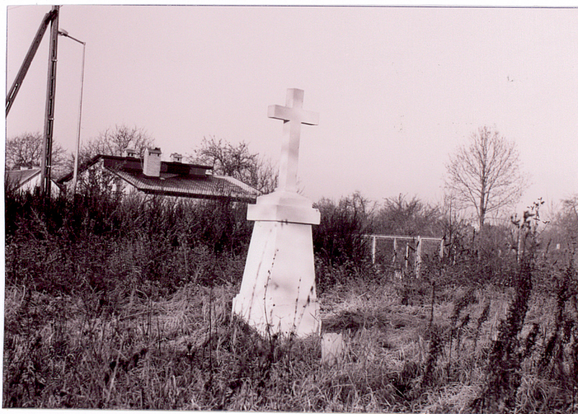
2. Kamienny krzyż pamiątkowy