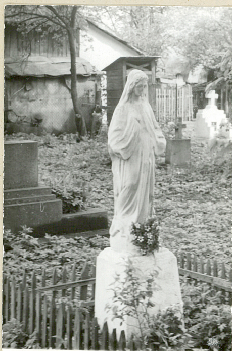
1. Nagrobek kamienny, pocz. XXw. (brak napisów)