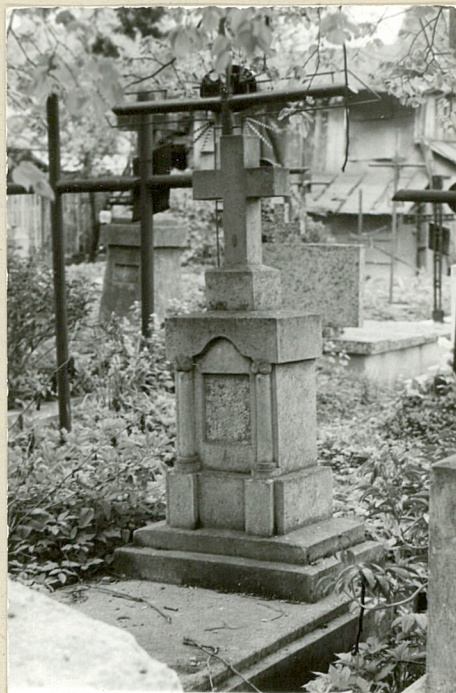
6. Nagrobek kamienny, pocz. XXw. (brak napisów)