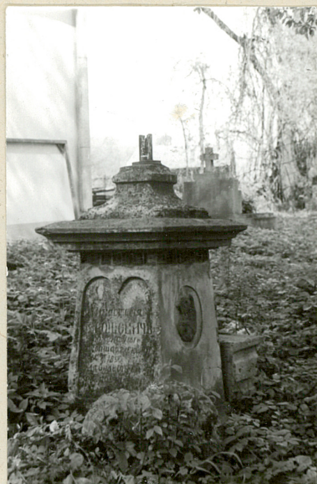
2. Nagrobek kamienny z utraconym krzyżem, Wroszowicz zm. 1890r.