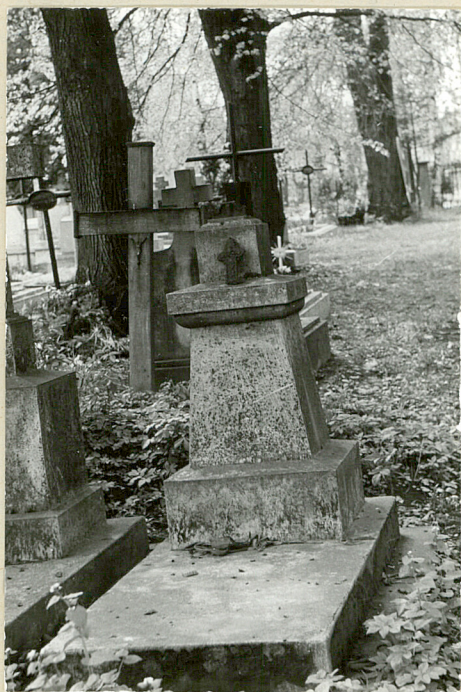
7. Nagrobek kamienny z utraconym krzyżem (brak napisów), pocz. XXw.