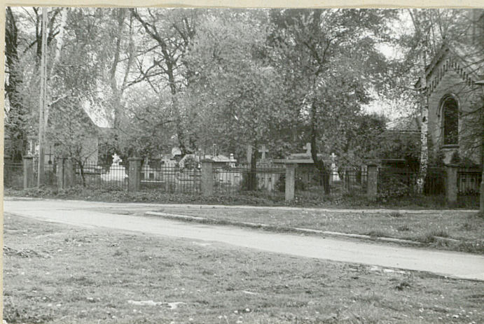
11. Widok ogólny od zach.