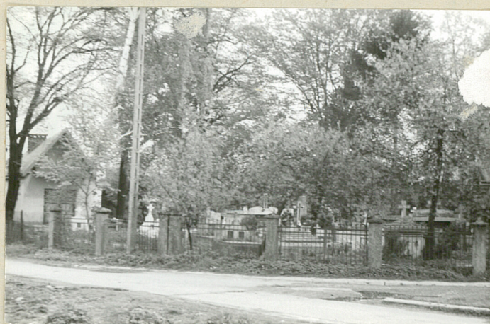
10. Widok ogólny od pzn.-zach.