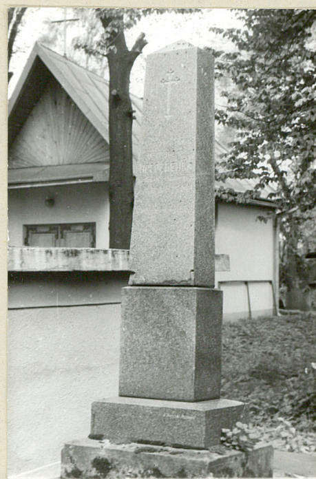
4. Obelisk granitowy Petronela Nehrebecka zm. 1907r.