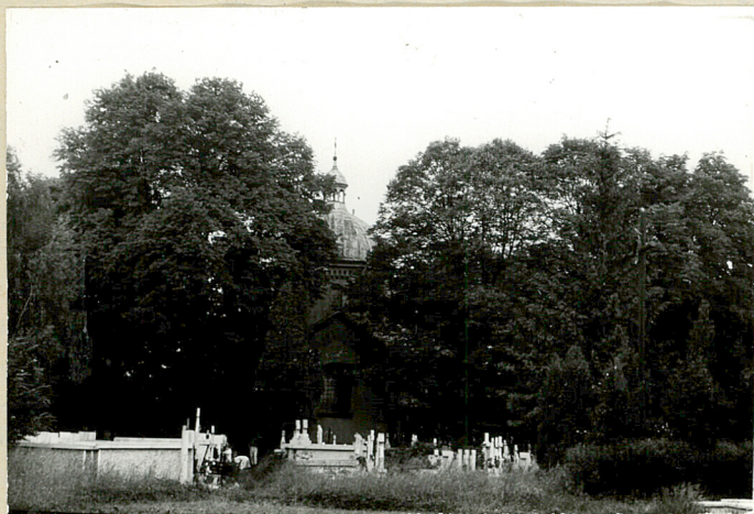
9. Widok ogólny od strony pld.