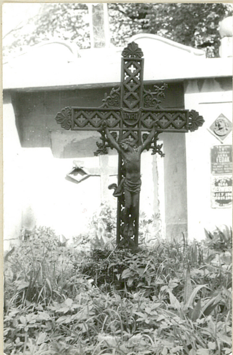
5. Nagrobek z krzyżem żel., przeł. XIX-XXw.