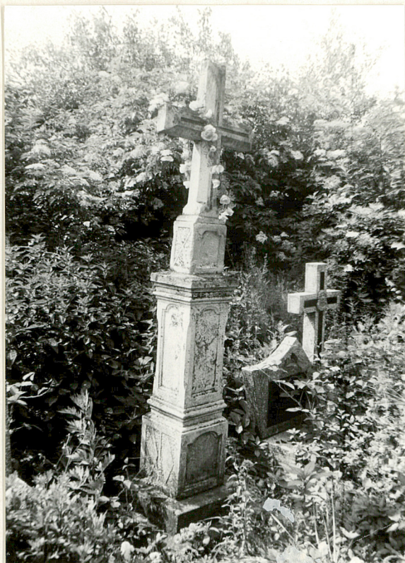
5. Nagrobek kamienny /napis nieczytelny/ pocz. XX w.