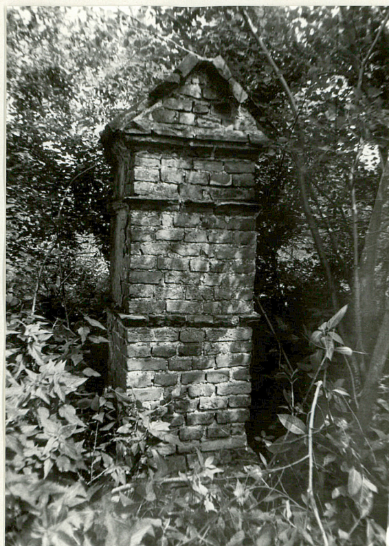
2. Nagrobek murowany /napisów brak/ k. XIX w.