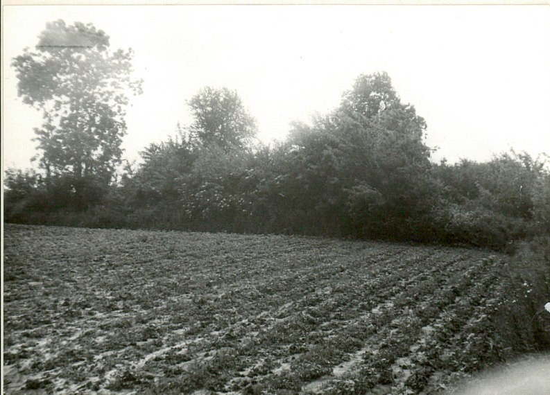
7. Widok z pól