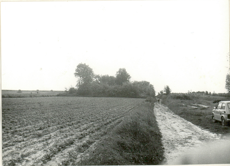
8. Widok od wsi.