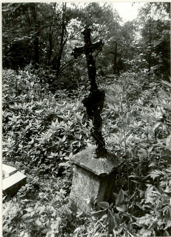
1. Nagrobek z krzyżem żel. /napisów brak/ k. XIX w.