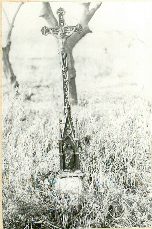
Krzyż z 2 poł. XIX w.