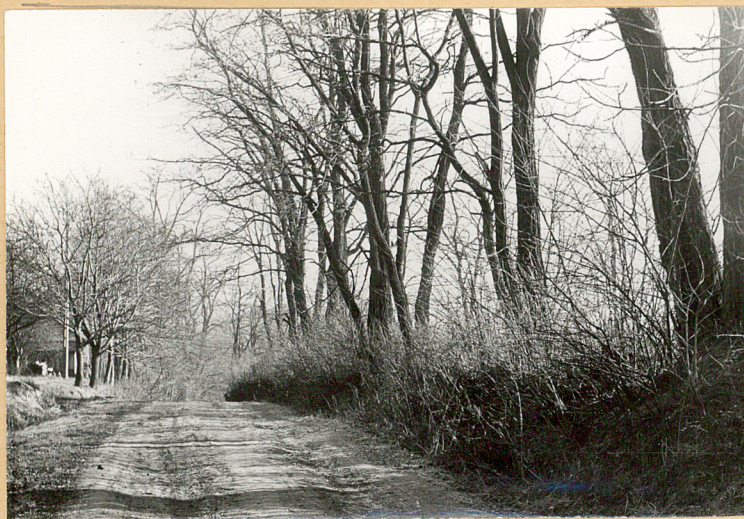
Wschodnia granica cmentarza