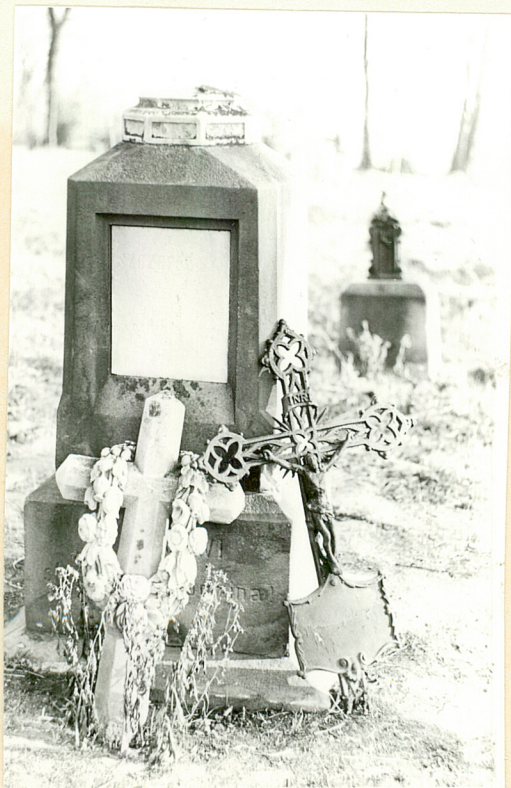
Fragmenty zniszczonych nagrobków i krzyży