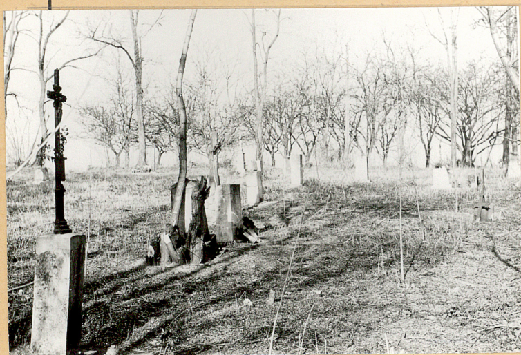
Wschodnia część cmentarza