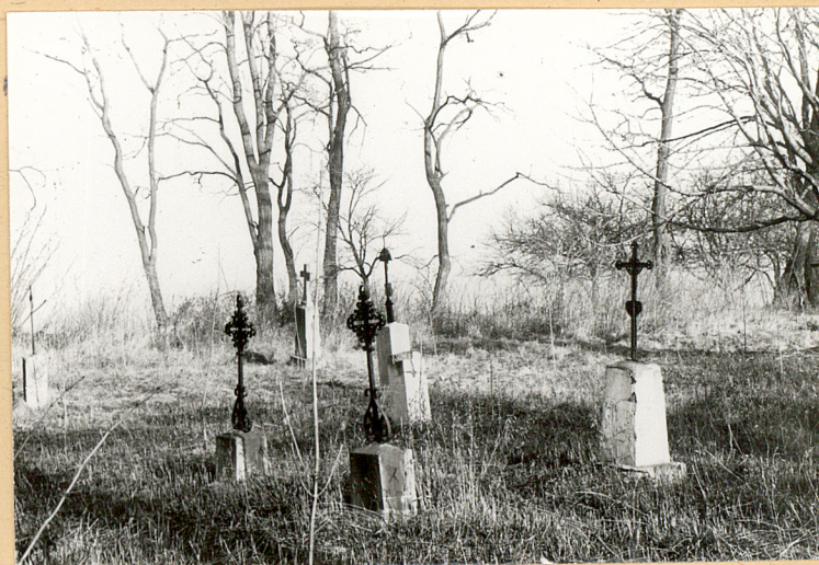
Zachodnia część cmentarza