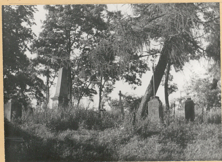
Środkowa część cmentarza