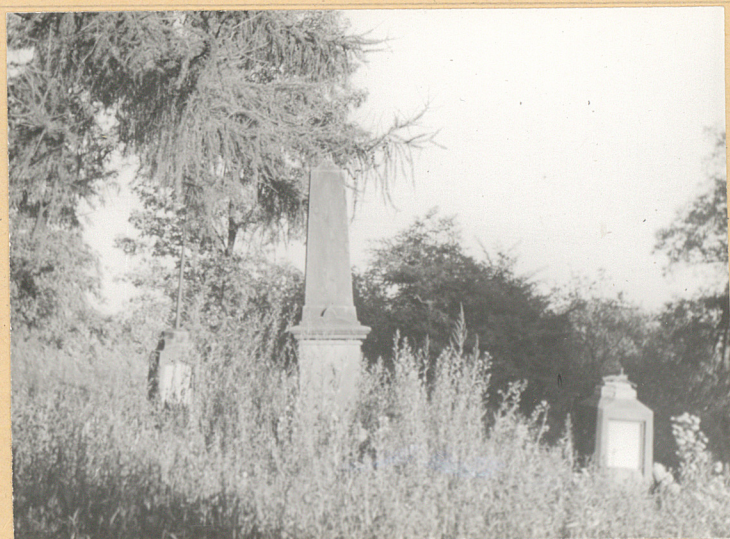
Środkowa część cmentarza