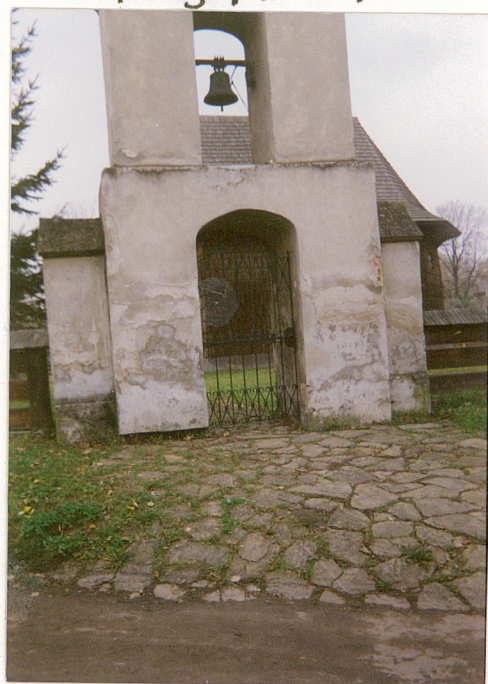
Dzwonnica z 1872 r.