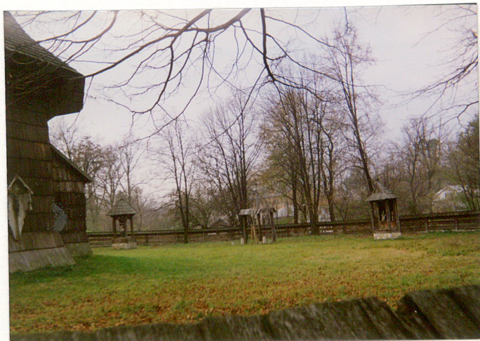
Teren d. cmentarza przykościelnego z ekspozycją kapliczek.