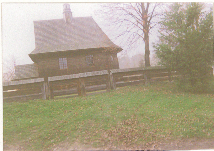
Widok z drogi na zespół kościelny