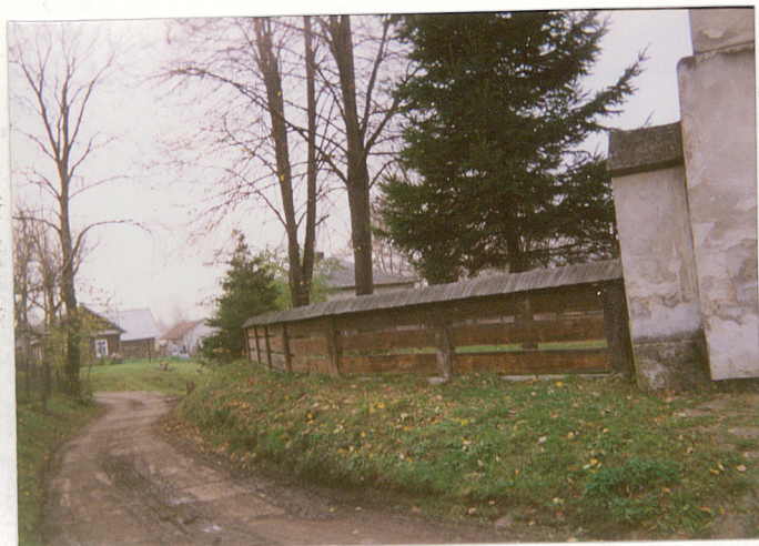
Zachodnia część ogrodzenia.