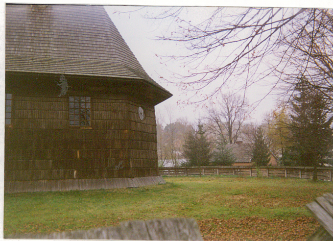
Teren d. cmentarza.