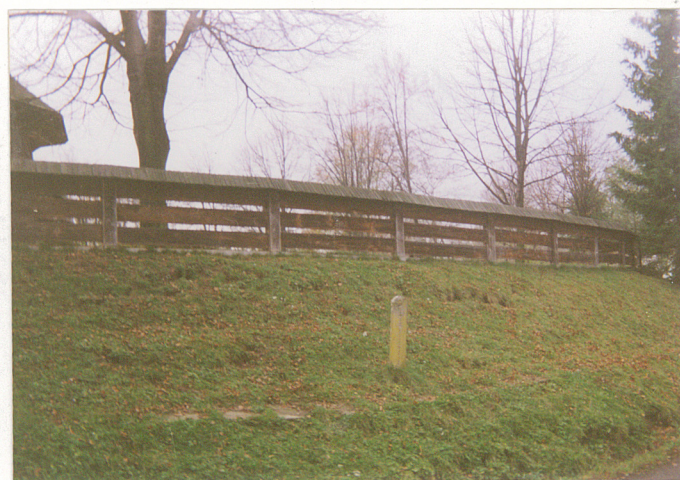
Pozostałości d. obwatowań ziemnych wokół zespołu kościelnego.