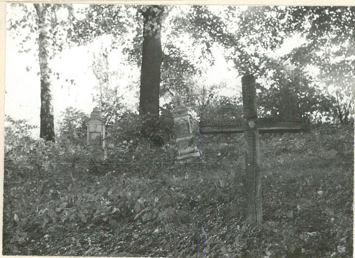
Ciemna część cmentarza