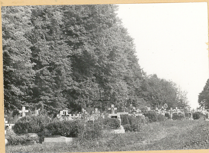
Środkowa część cmentarza