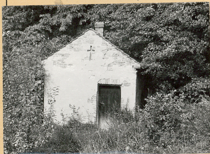
Kostnica przy węjsćiu na cment.