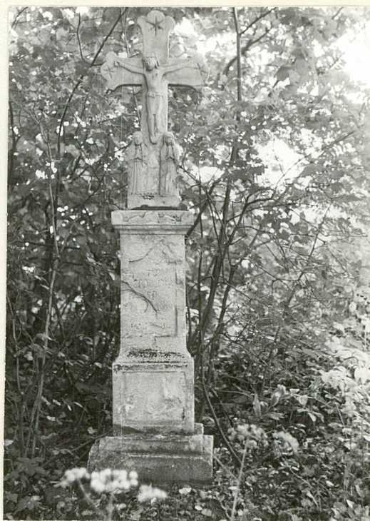
10 Nagrobek M. H.