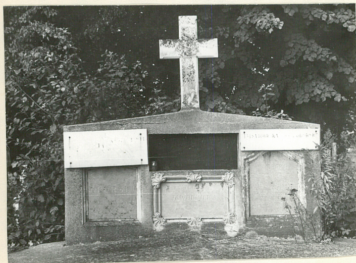
Grobowiec rodziny Oborskich byłych właścicieli Husowa