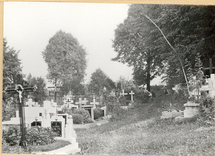
Ścieżka biegnąca przez cmentarz