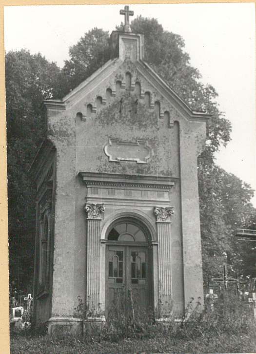
Kaplica pogrzebowa z k. XIX w.