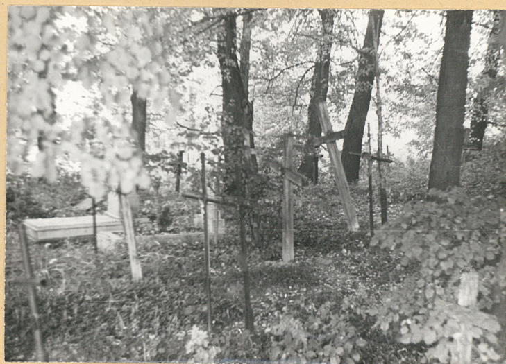
Wnętrze starszej części cmentarza