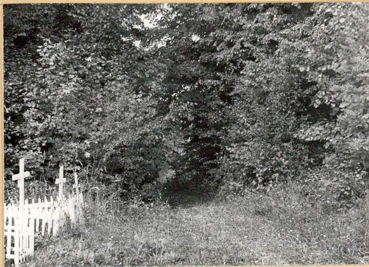
Węjsćie na cmentarz