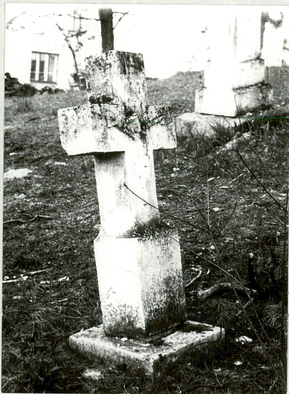
12. Nagrobek kamienny, NN, k. XIX w.