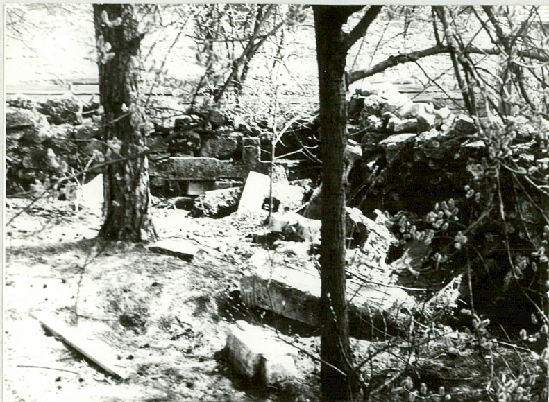
6. Grupa powalonych kamiennych nagrobków z przeł. XIX-XX w.