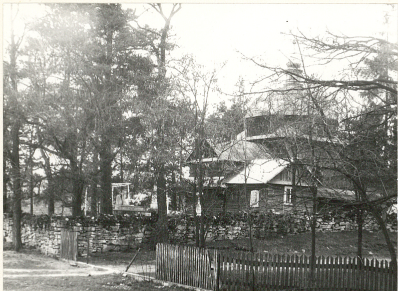
1/ Widok ogólny od ptn. - wsch.