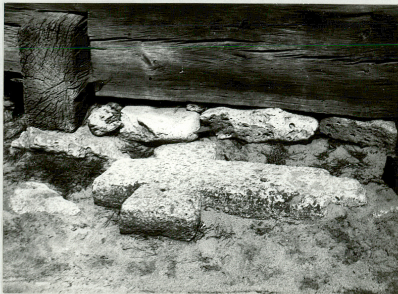
9. Krzyż kamienny, NN, 1 poł. XIX w.