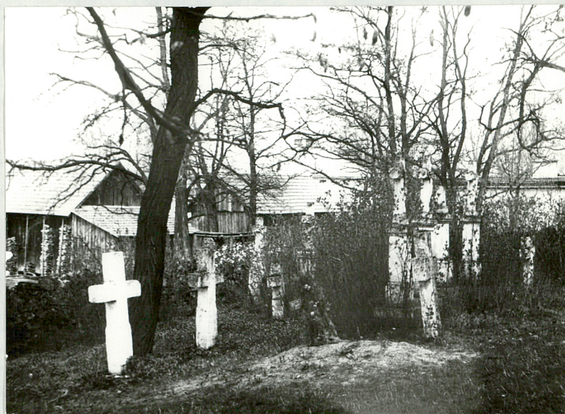
15. Nagrobki w zachodniej części cmentarza.