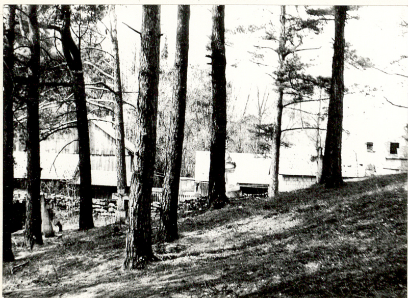
3/ Widok na część zachodnią.