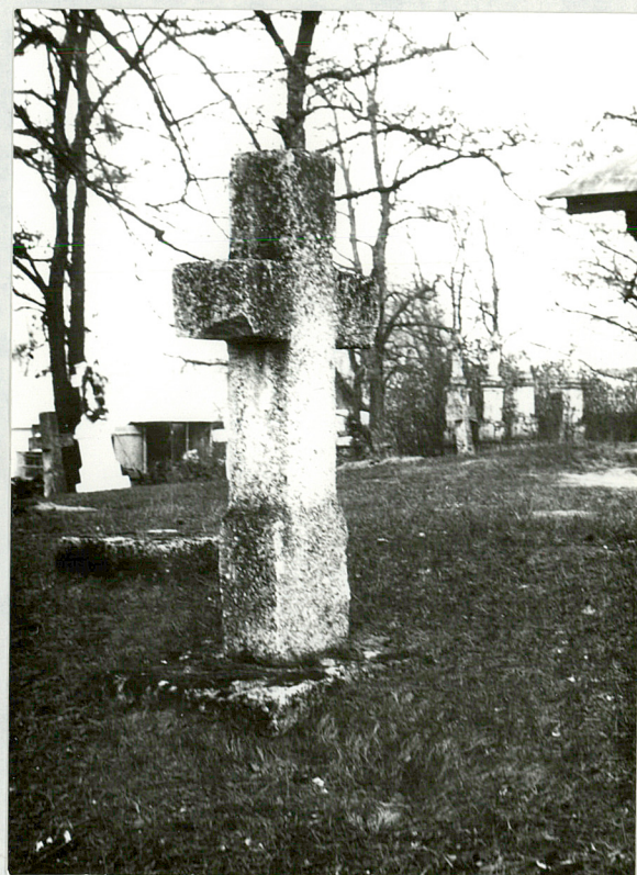
13. Krzyż kamienny, NN, k. XIX w.