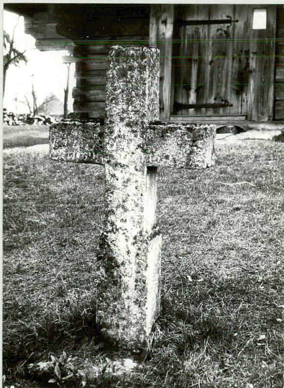
8. Krzyż kamienny, NN, przeł. XIX-XX w.