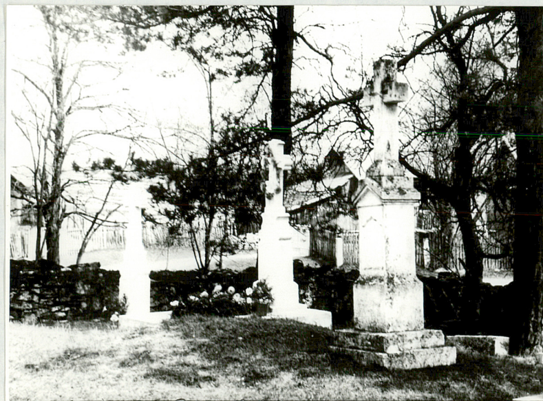
16) Trzy nagrobki kamienne z pocz. XX w. we wschodniej części cmentarza.