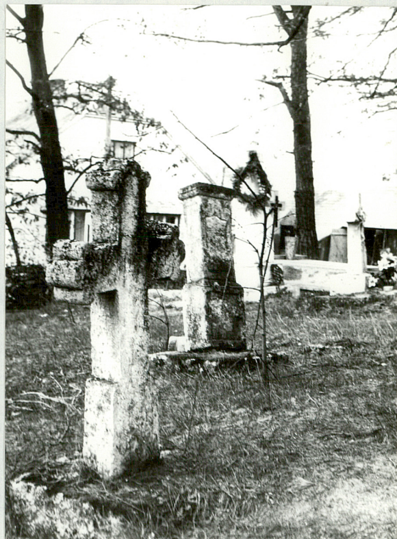
7) Krzyż kamienny, NN, przeł. XIX-XX w.