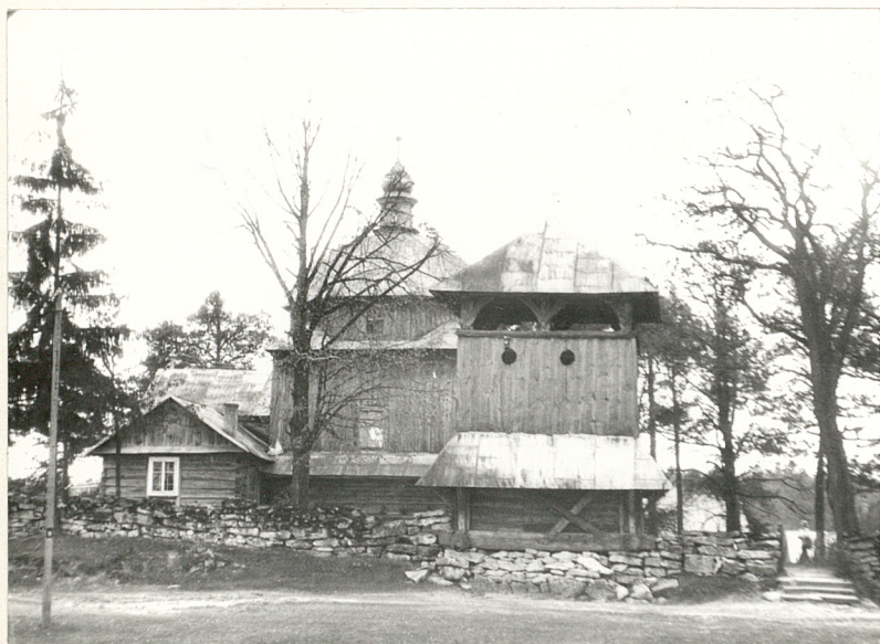
2/ Widok ogólny na cerkiew i dzwonnice