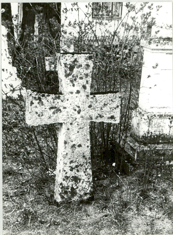
14. Krzyż kamienny, NN, zm. 1860 r.