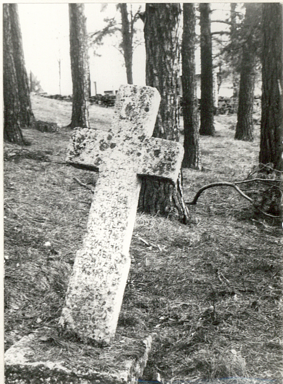
5/ Krzyż kamienny, 1 poł. XIX w.