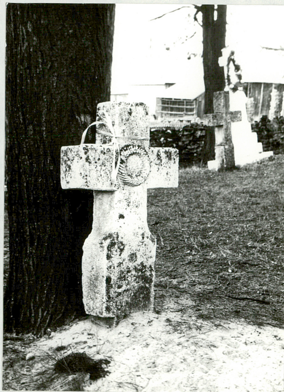
11, Krzyż kamienny, NN, zm. 1895 r.