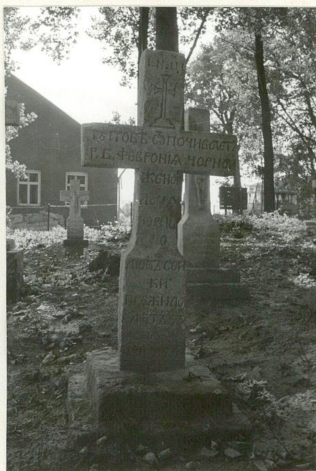
25. Krzyż kamienny z 1874r.