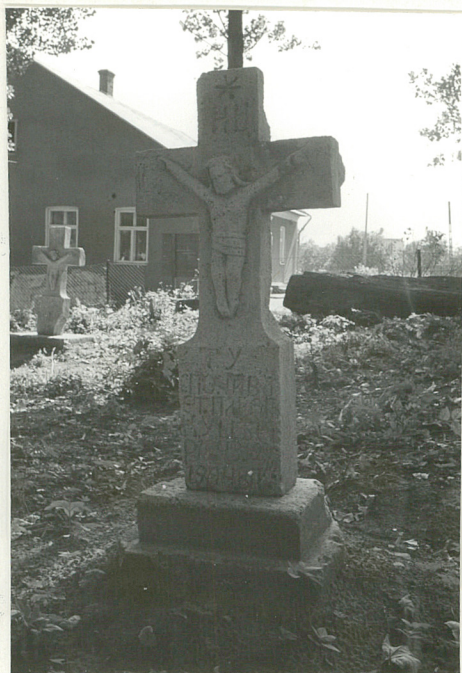
15. Krzyż kamienny z 1904r.