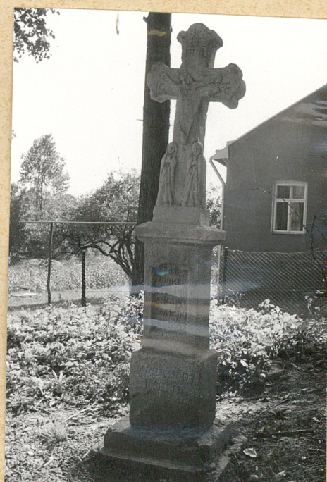
4. Krzyż kamienny z 1907r. (napis nieczytelny)