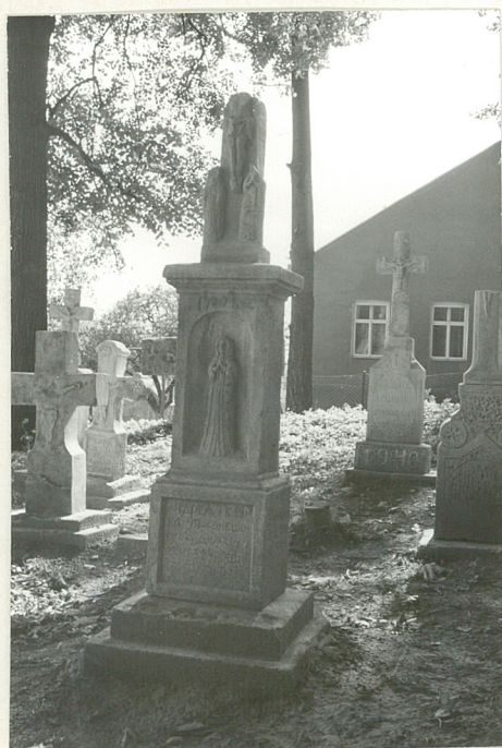
27. Nagrobek uszkodzony z 1904r.