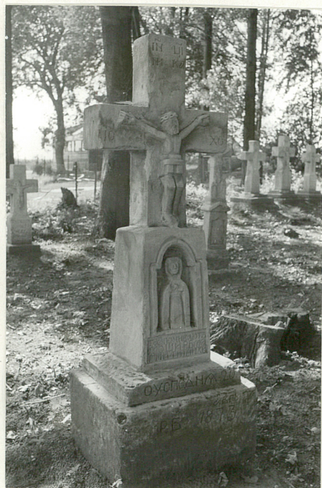
13. Krzyż kamienny z 1873r.