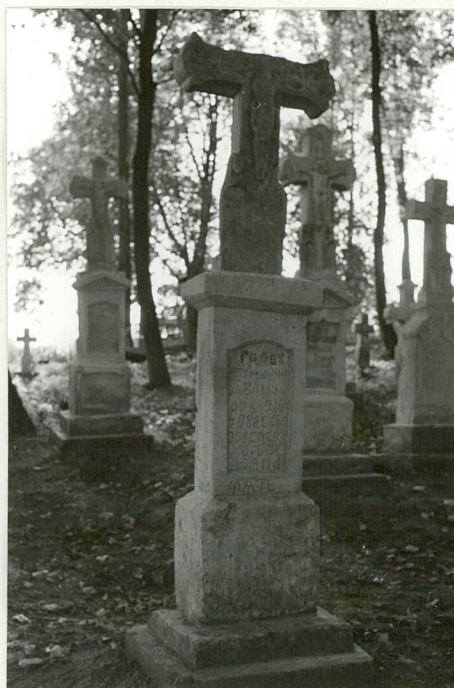
36. Krzyż kamienny z 1907r.