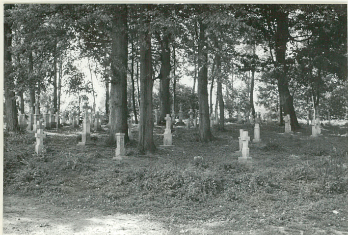
45. Widok ogólny