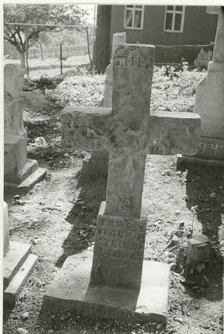
9. Krzyż kamienny z 1876r.