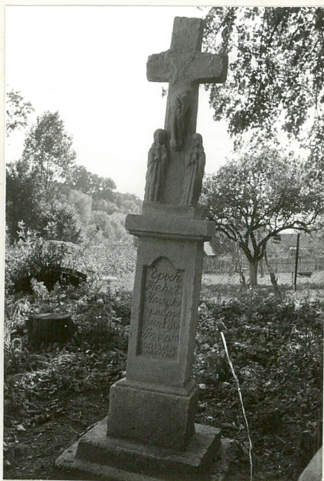
5. Krzyż kamienny z 1903r.