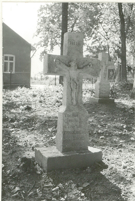
11. Krzyż kamienny Simeon Starcz.. + 1899r.