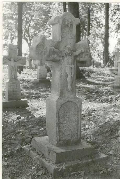
12. Krzyż kamienny z 1896r.