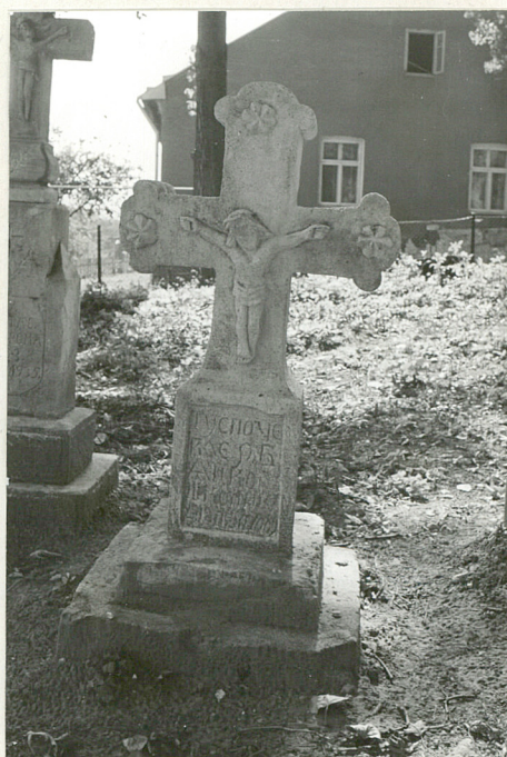
8. Krzyż kamienny z 1876r.