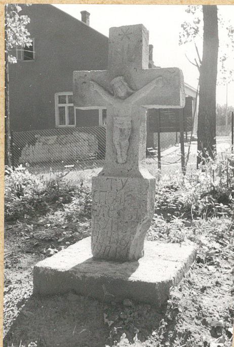
1. Krzyż kamienny z 1917r. (napis nieczytelny)