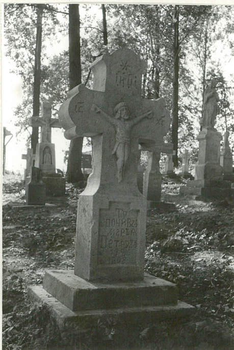
31. Krzyż kamienny z 1908r.