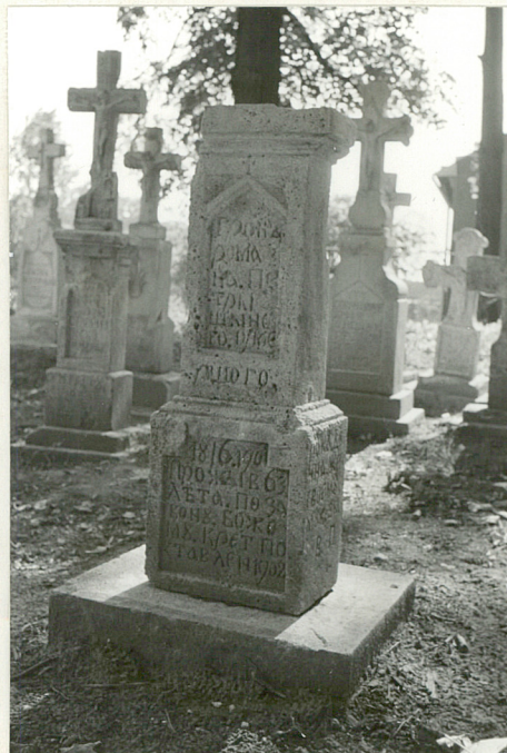
28. Nagrobek uszkodzony z 1902r.