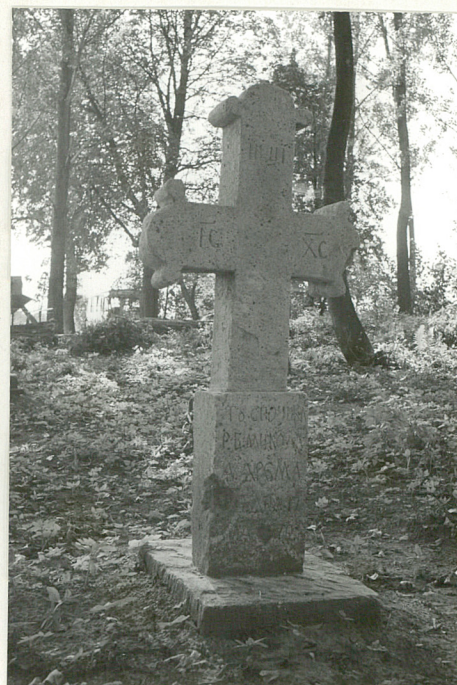
16. Krzyż kamienny z XIX w.