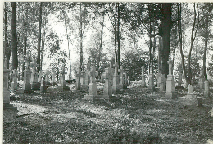
46. Widok ogólny