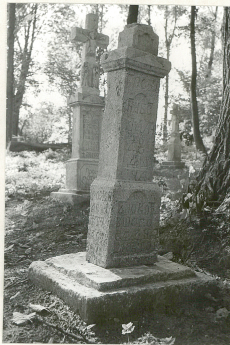
20. Nagrobek uszkodzony z 1877r.