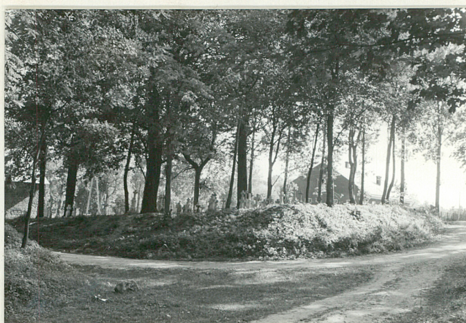
47. Widok ogólny