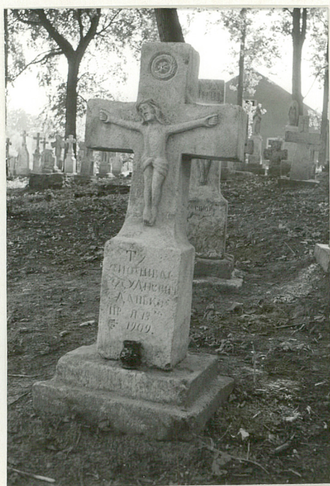
43. Krzyż kamienny z 1909r.