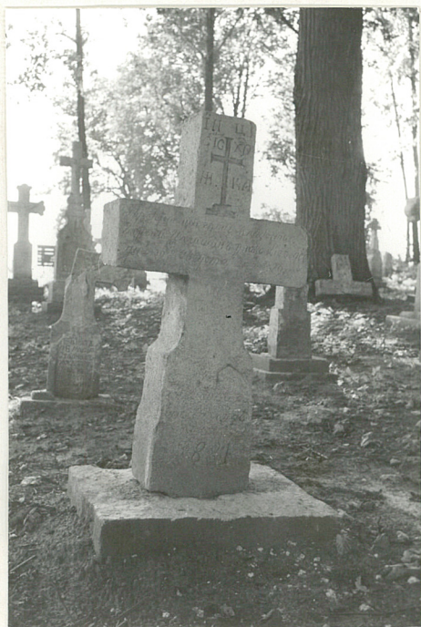
33. Krzyż kamienny z 1881r.