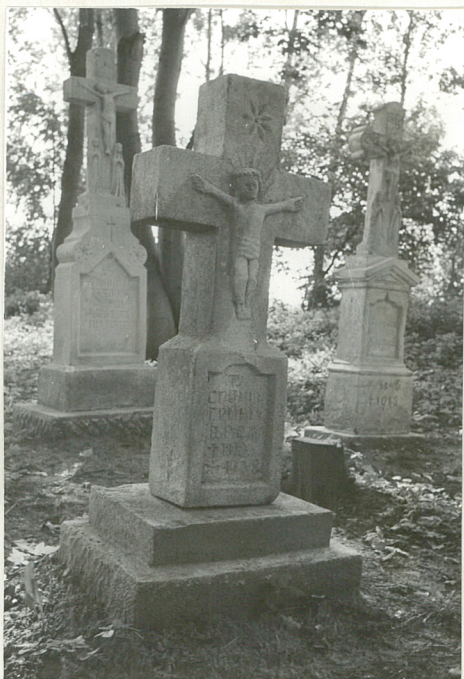
39. Krzyż kamienny z 1910r.