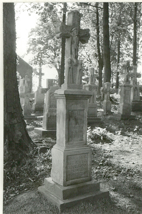
30. Krzyż kamienny z 1904r.