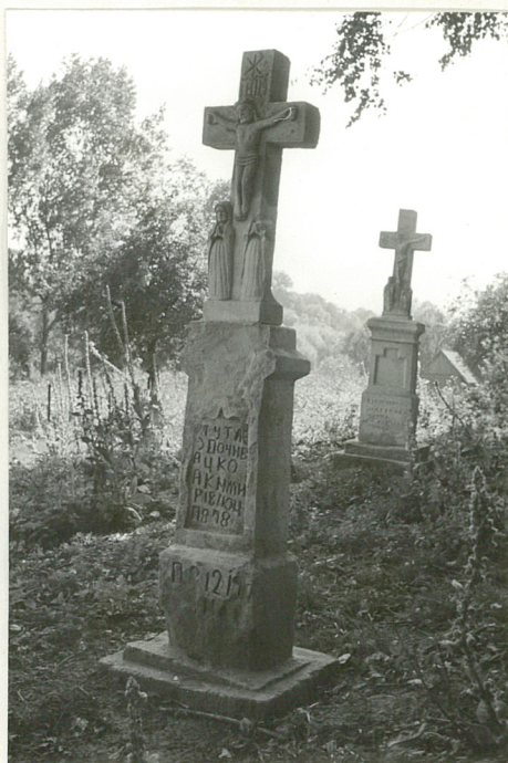
29. Krzyż kamienny z 1910r.