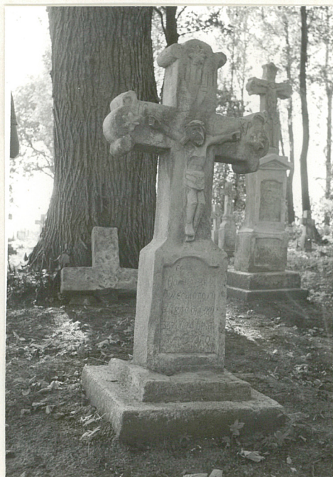
17. Krzyż kamienny z 1889r.