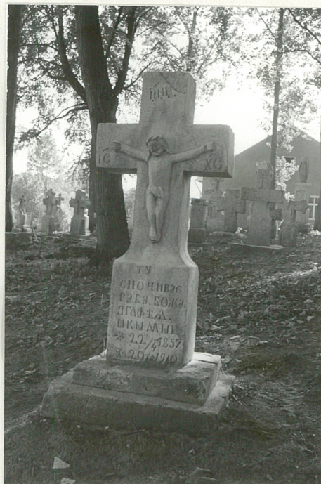
42. Krzyż kamienny z 1910r.