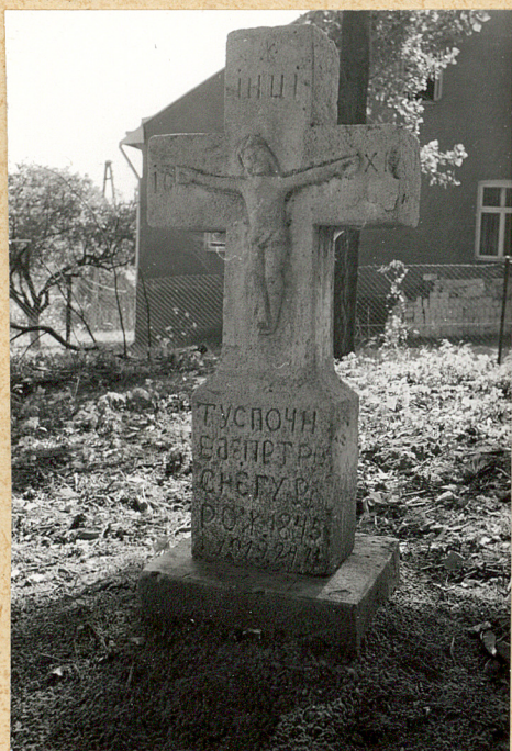
3. Krzyż kamienny z 1919r. (napis nieczytelny)