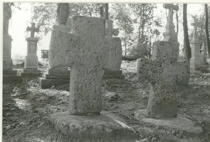
24. 2 krzyże kamienne z XIX w.