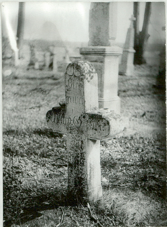
5. Krzyż kamienny, Mora Gazirn, + 1862r.