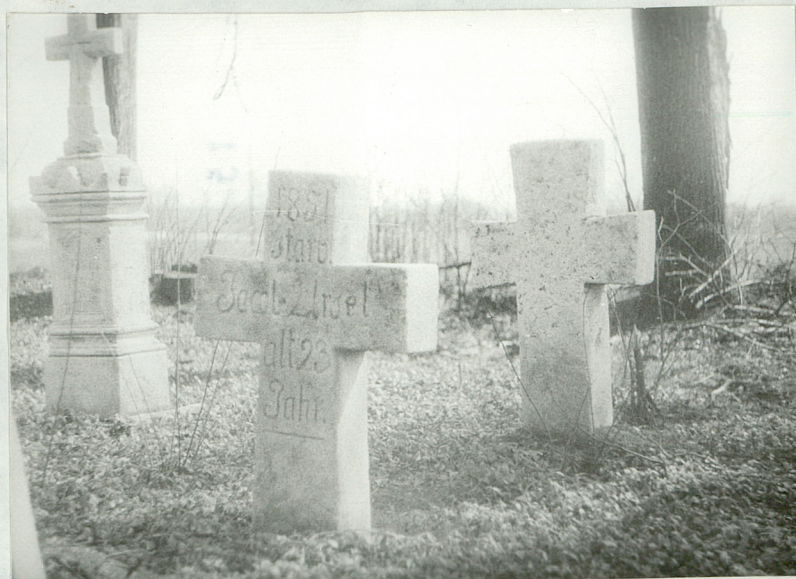
6. 2 krzyże kamienne, Jacol Ursel + 1851r., drugi bez napisów