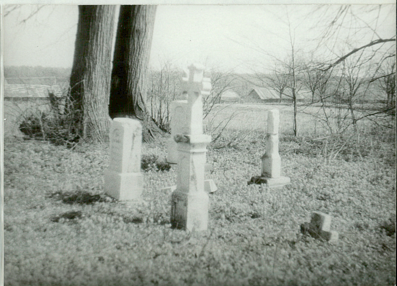
4. Nagrobki z k. XIXw. w części wschodniej.