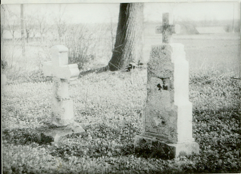
9. 2 kamienne nagrobki, napisy nieczytelne, pocz. XXw.