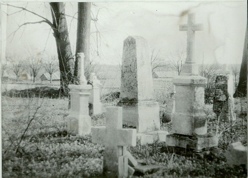
2. Nagrobki z k. XIXw. w południowo-wschodniej części cmentarza