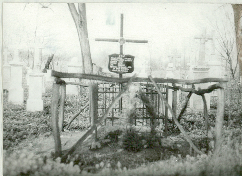
11. Mogiła z 1944r. Polaków, którzy zginęli z rąk bandy UPA.