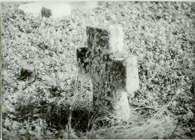
10. Krzyż kamienny, Johan Sch... + 1835r.