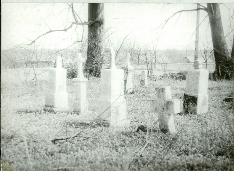
3. Nagrobki z k. XIXw. w części wschodniej