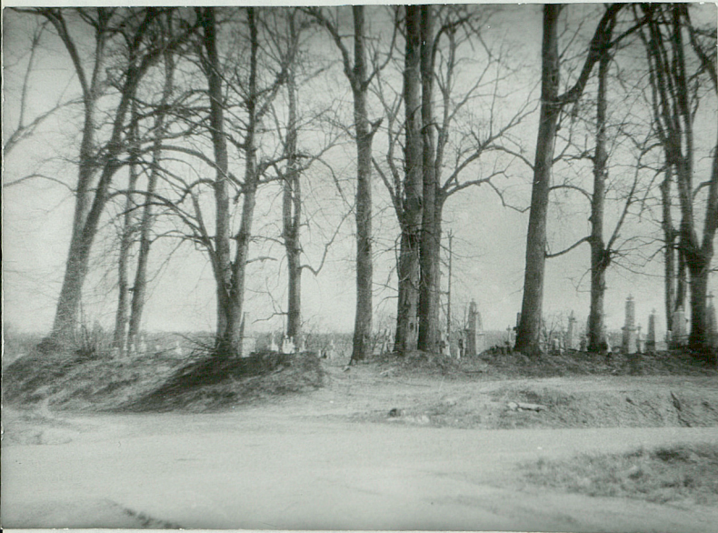
I. Widok ogólny