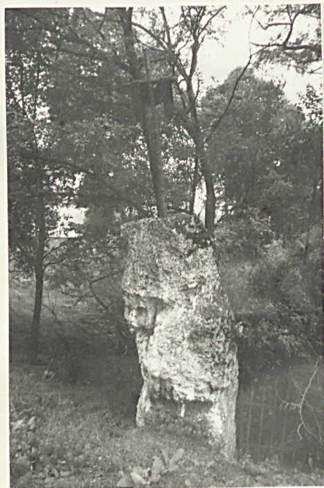
36. Nagrobek z krzyżem żel. z k. XIX w. /napisów brak/