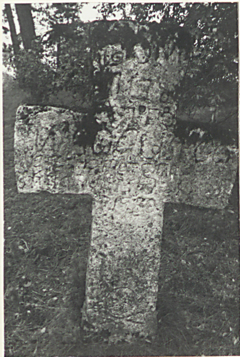
33. Krzyż kamienny z 1870r.