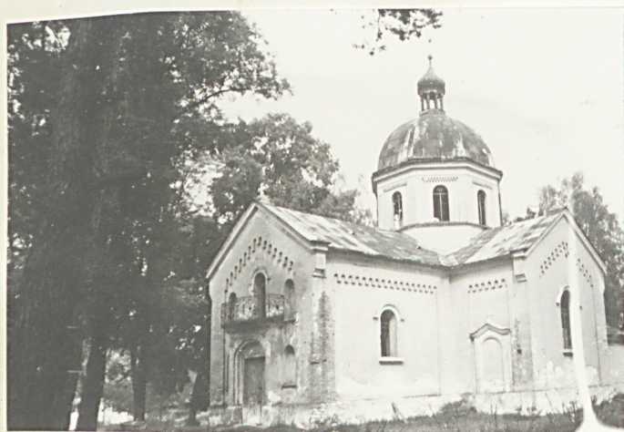
37. Cerkiew murowana