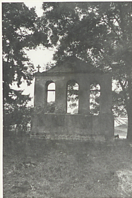
38. Dzwonnica mur.