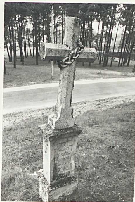
10. Nagrobek kamienny Michaił Moros /data nieczytelna/