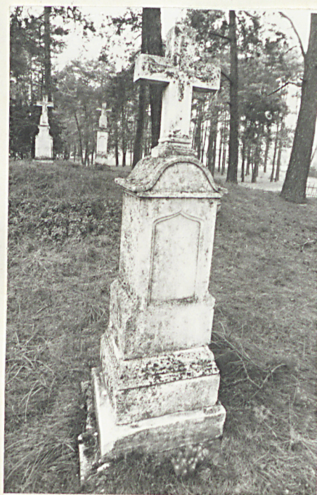
2. Nagrobek kamienny pocz. XX w. /napisów brak/