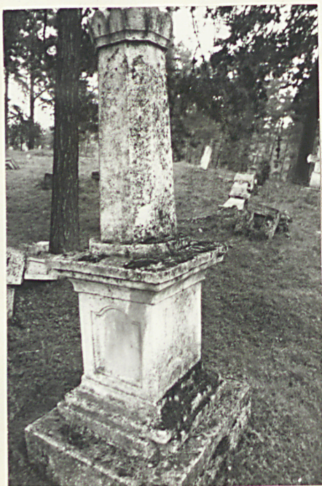
7. Nagrobek kamienny k. XIX w. /napisów brak/