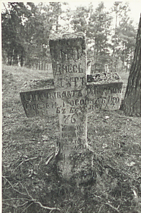
19. Krzyż kamienny z 1872r.