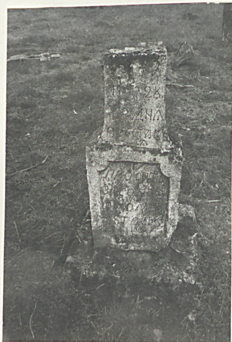
34. Nagrobek uszkodzony z 1864r.