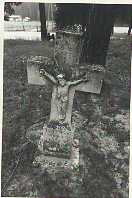
24. Nagrodek uszkodzony z 1899r.