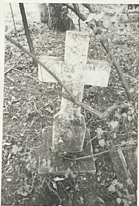
30. Krzyż kamienny z 1898r. /napis nieczytelny/