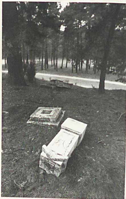
4. Zniszczone nagrobki kamienne pocz. XX w. /napisów brak/