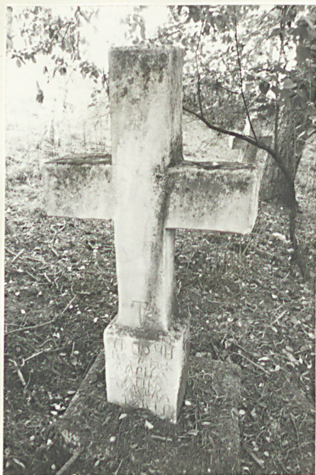
31. Krzyż kamienny z 1893r.