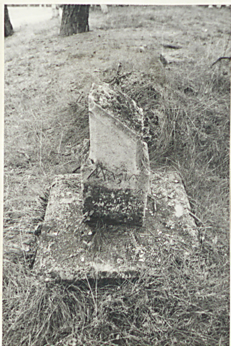
21. Nagrodek uszkodzony z 1884r.