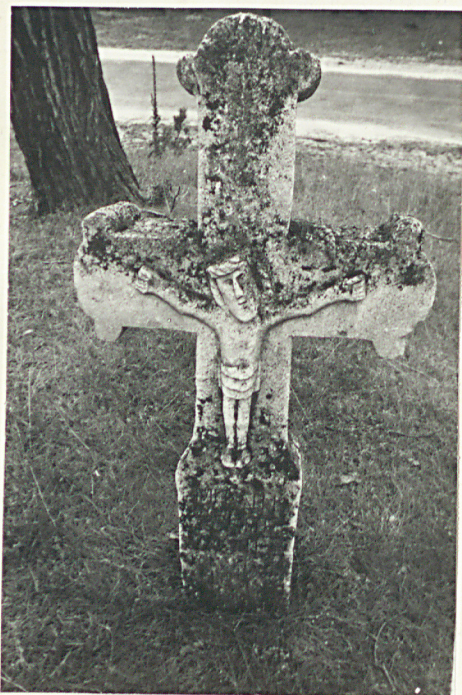
11. Nagrobek kamienny /napis nieczytelny/ z 1882r.