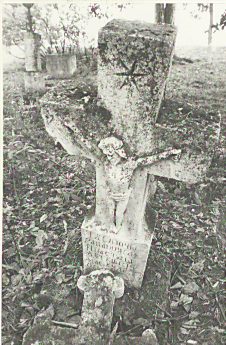
27. Krzyż kamienny z 1913r.