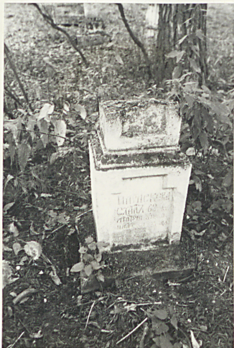
29. Nagrobek uszkodzony z 1898r.