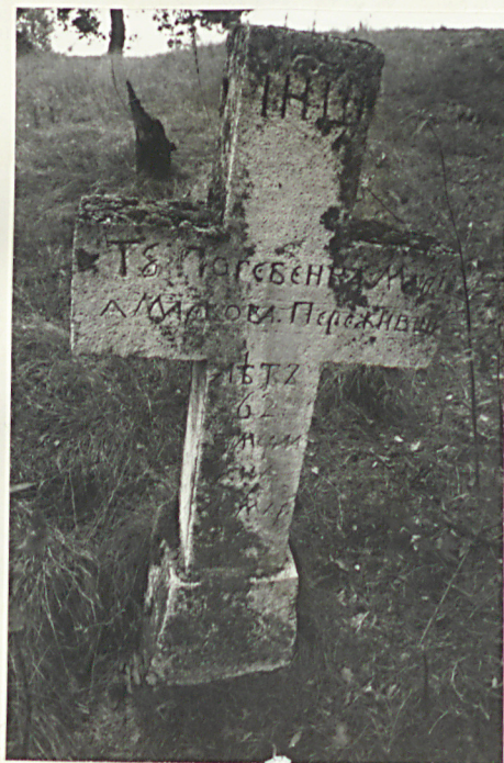
32. Krzyż kamienny z 1861r.