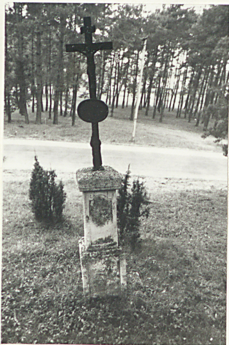
9. Nagrobek z kryżem żel. /napisów brak/ k. XIX w.