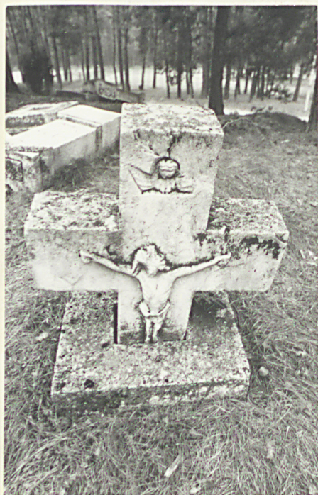
3. Nagrobek kamienny pocz. XX w. /napisów brak/