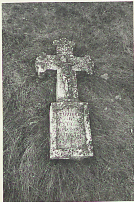
35. Nagrobek uszkodzony z 1911r.