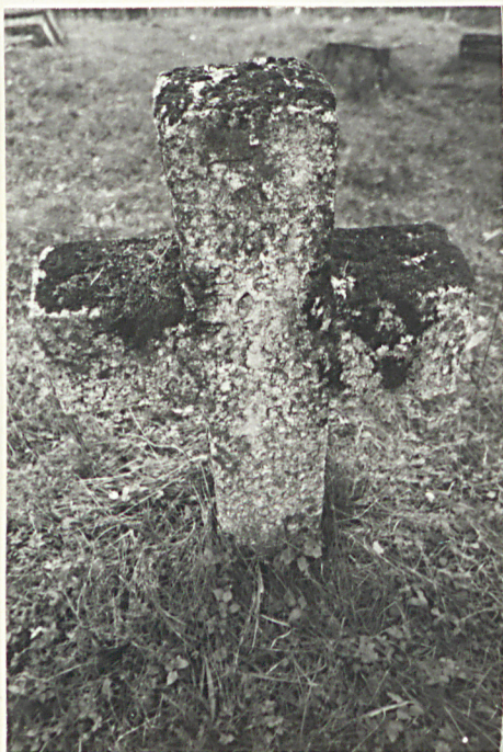
13. Nagrobek kamienny /napisów brak/ k. XIX w.