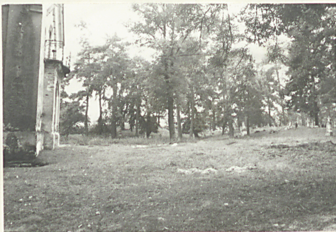
39. Widok ogólny