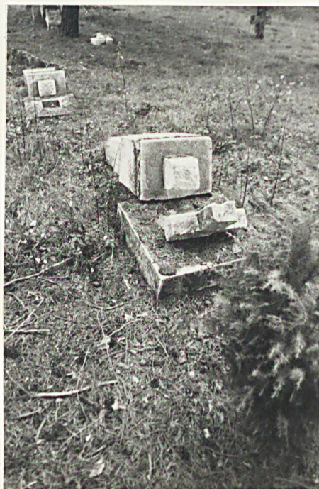
6. Nagrobek uszkodzony /napis nieczytelny/ pocz. XX w.