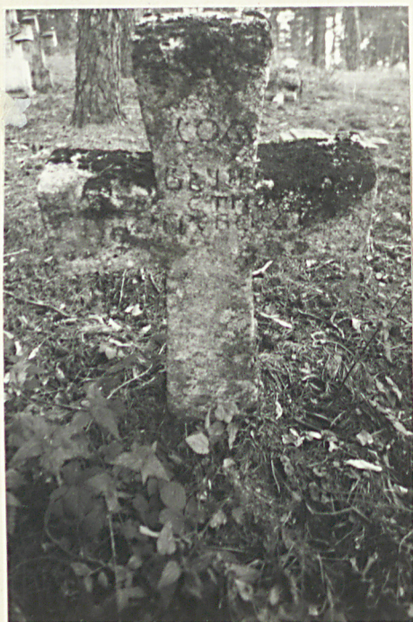
15. Krzyż kamienny /napis nieczytelny/ k. XIX w.