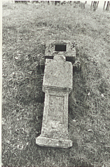
20. Nagrobek uszkodzony z 1902r.