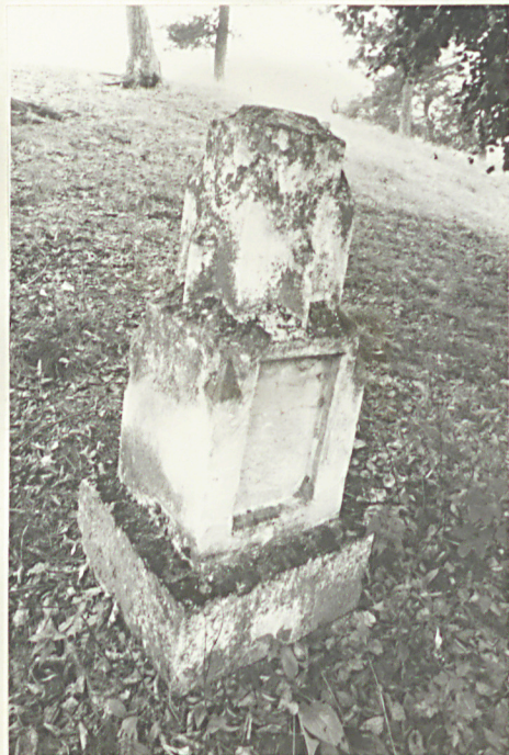
28. Nagrobek uszkodzony z XIX w. /napisów brak/