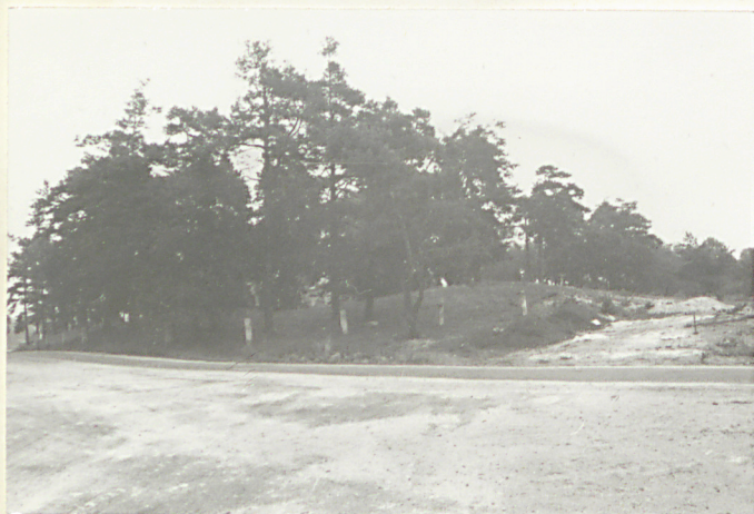
1. Widok ogólny