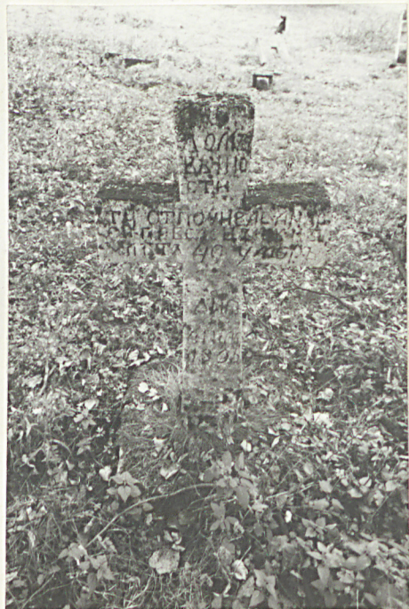
26. Krzyż kamienny z 1865r.