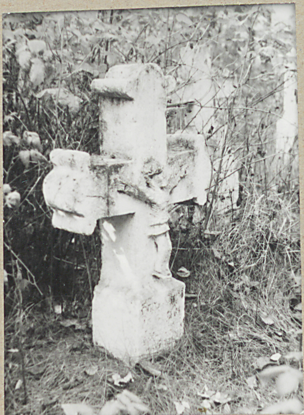
4) Nagrobek kamienny, napis nieczytelny, 1918 r.