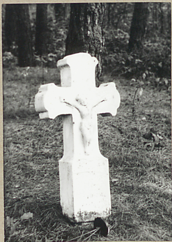
5) Nagrobek kamienny, napis nieczytelny, 1918 r.