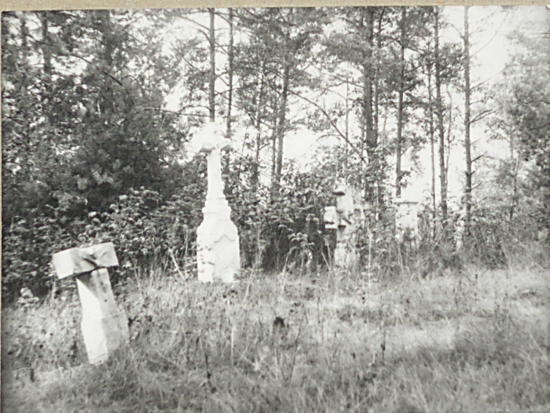
3) Widok na zachodnią część cmentarza