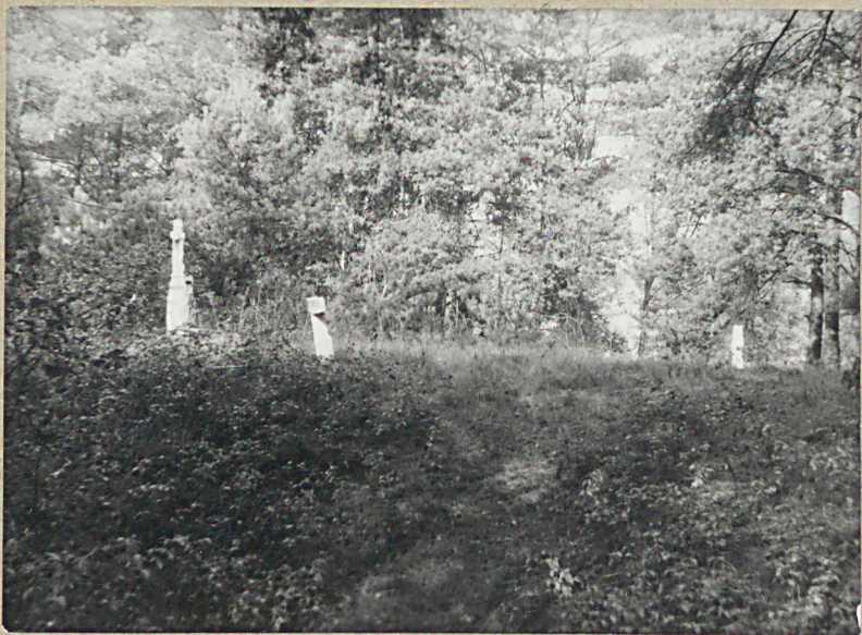
1) Widok ogólny od strony południowej.