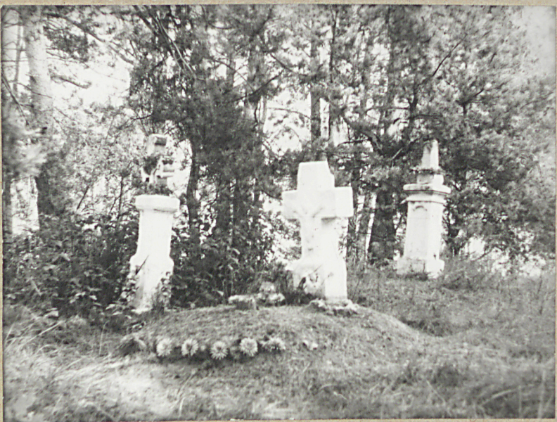
2) Grupa nagrobków w części zachodniej