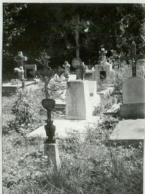
7) Żeliwne krzyże, pocz. XX w.