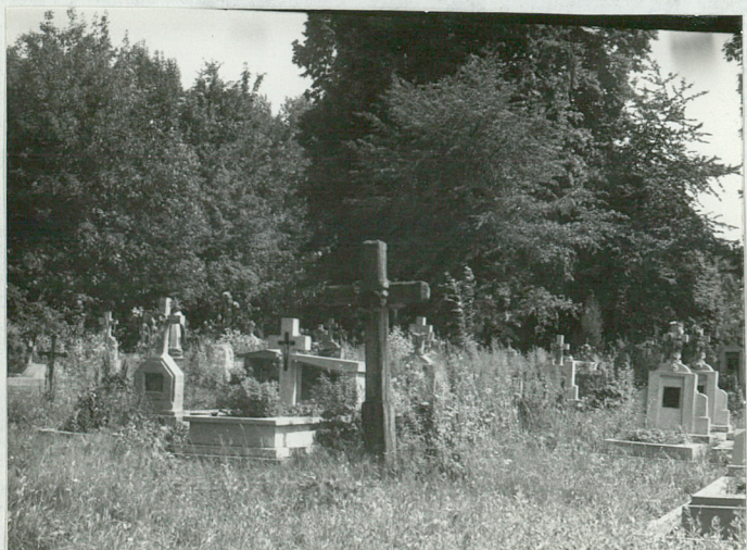
3)Widok na starszą część północną.