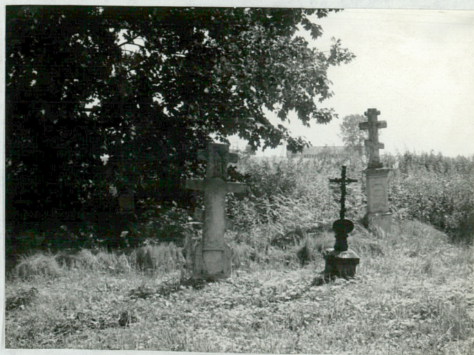
4)Nagrobki w tylnej części cmentarza, pocz.XX w.