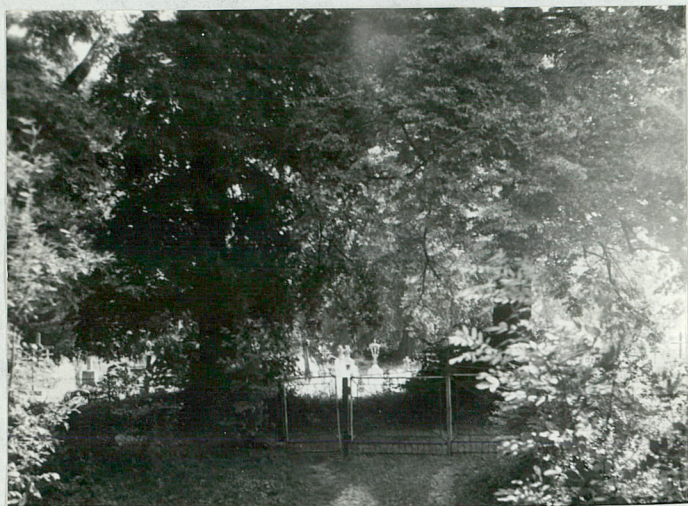
1)Widok na wejście na cmentarz.