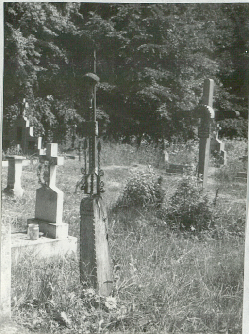
9) Krzyż metalowy na drewnianym szupie, 1933 r.