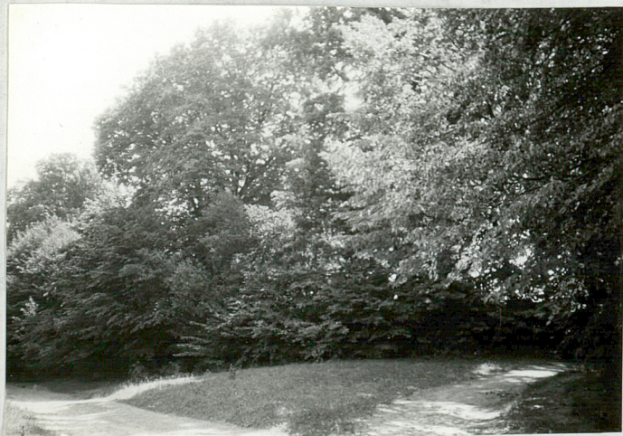
11/ Widok ogólny od strony zachodniej.