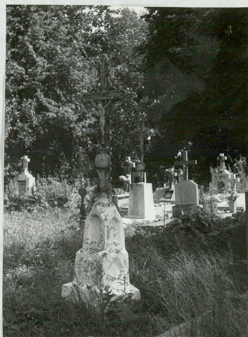
8) Żeliwny krzyż na kamien- nym postumencie, pocz. XX w.