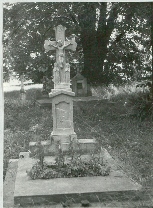
6) Nagrobek kamienny, napis nieczytelny, 1909 r.