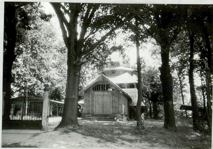
12/ Cerkiew - widok od wschodu