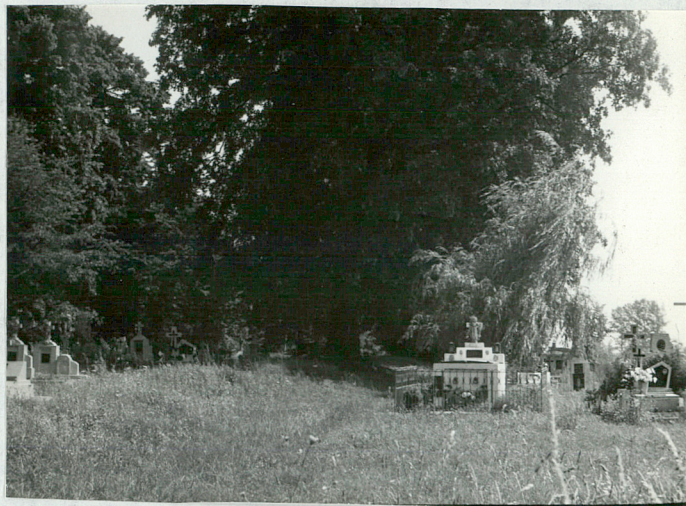
2)Widok ogólny cmentarza od wejścia.