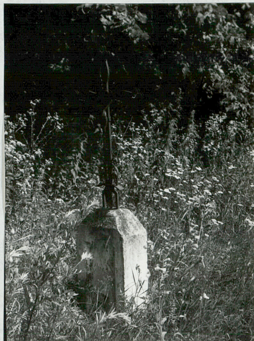
10) Krzyż metalowy na kamiennym postumencie.