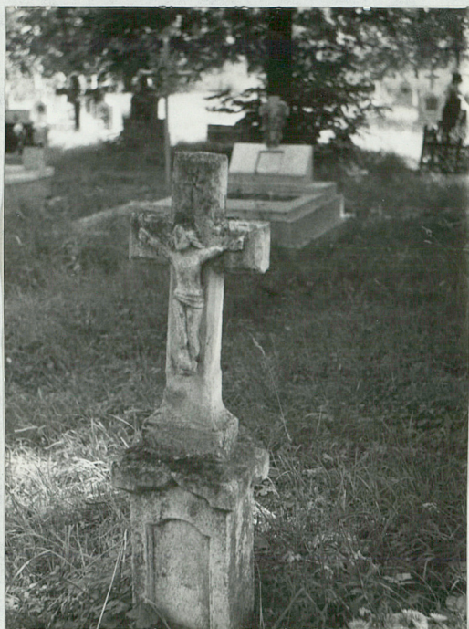
5) Nagrobek kamienny, przeł. XIX-XX w.