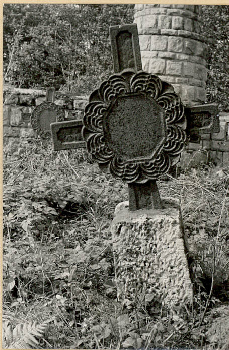
4. Krzyż żeliwny