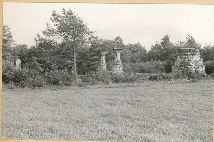
1. Widok z polnej drogi