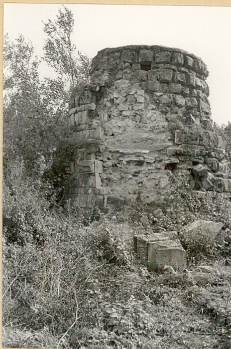
2. Murowana rotunda