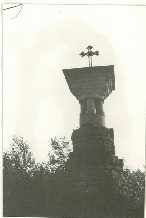
8. Kamienna Kolumna