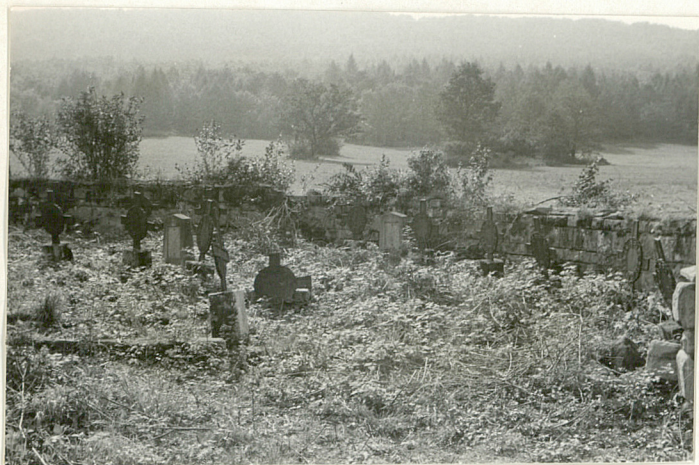
5. Widok ogólny