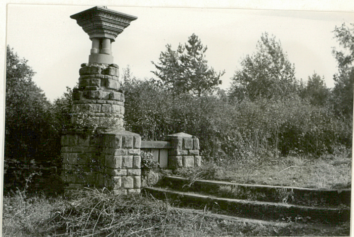
6. Widok ogólny