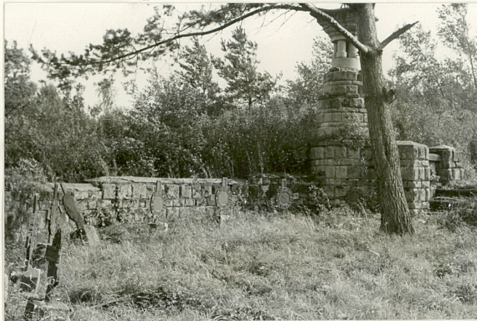
9. Widok ogólny