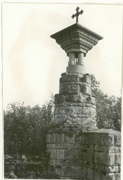
7. Kamienna kolumna