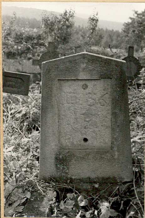
3. Nagrobek kamienny