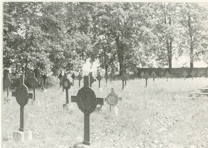
6. Kwaterna prawa