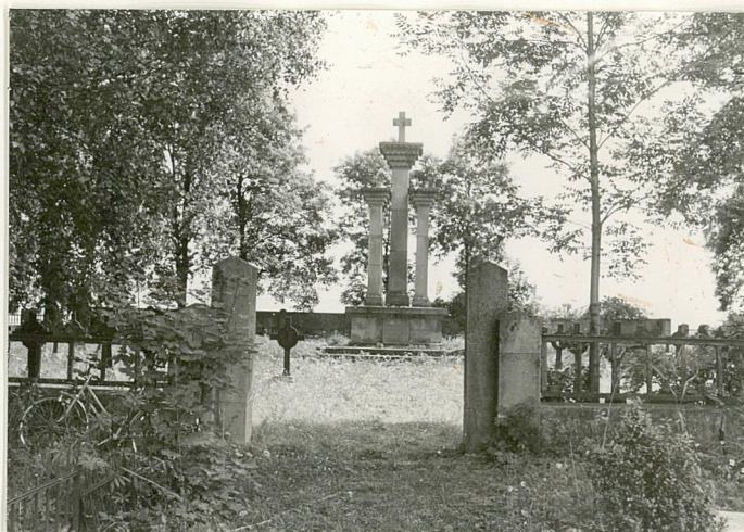
7. Widok ogólny