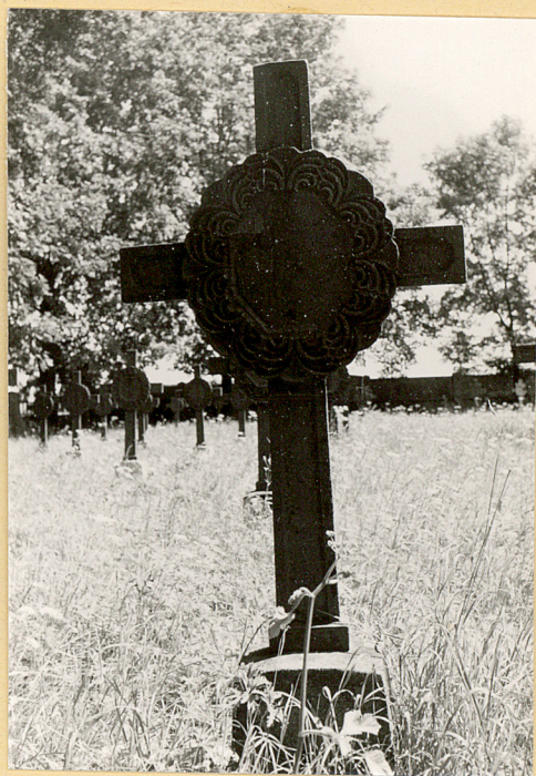
2. Krzyż żeliwny