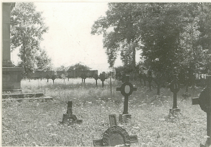
5. Kwaterna lewa