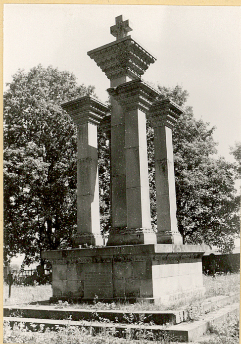
1. Pomnik kamienny