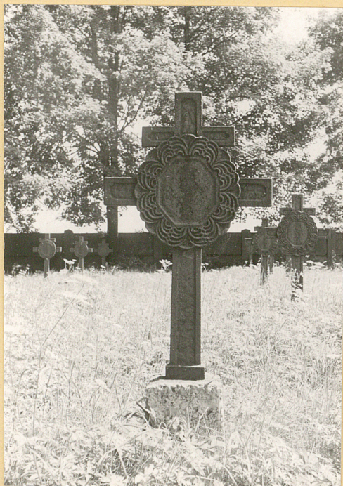
3. Krzyż żeliwny